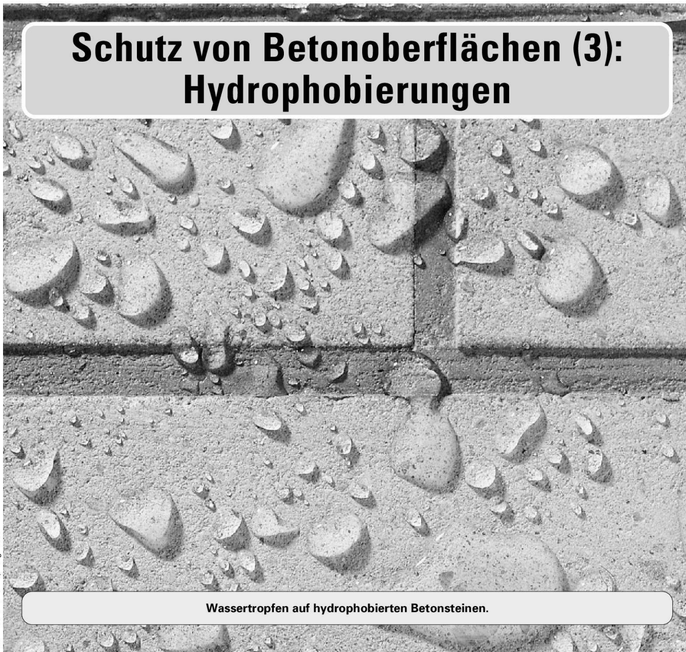
Wassertropfen auf hydrophobierten Betonsteinen.