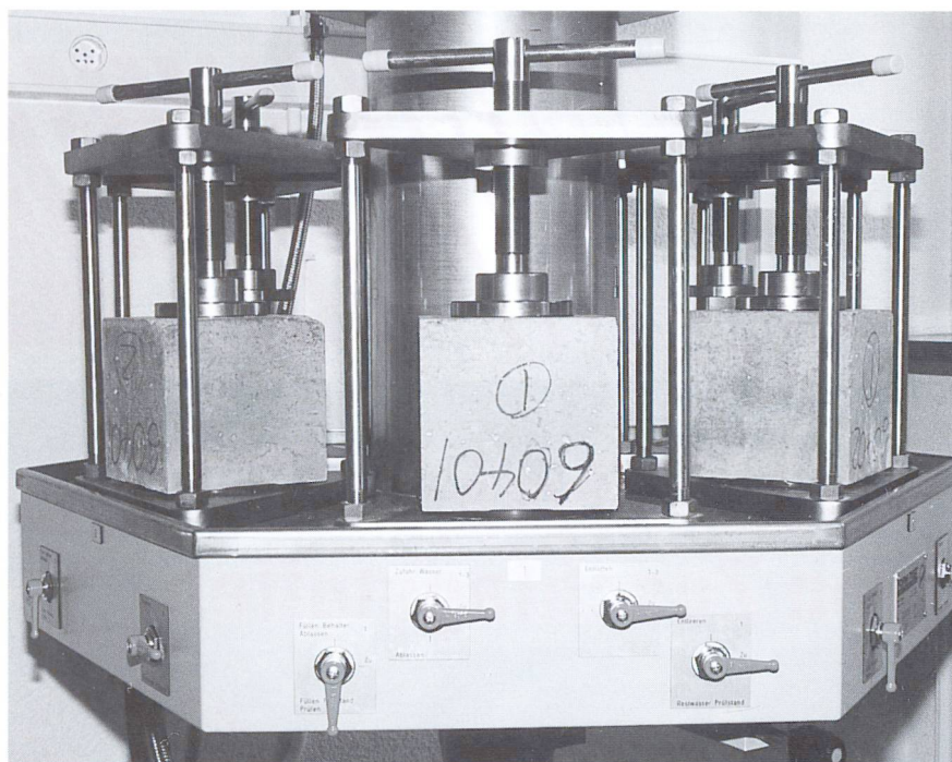
Versuchseinrichtung der TFB für Wasserundurchlässigkeitsprüfungen.

Mit der Wasserundurchlässigkeitsprüfung nach ISO 7031 hat das physikalische Labor der TFB eine weitere nützliche Prüfung in ihr Dienstleistungsangebot aufgenommen. Das Verfahren entspricht dem Normversuch der ENV 206, der auch in der Vornorm SIA V 162.051 enthalten ist. Es handelt sich dabei um eine Alternative zu Prüfungen (z. B. Darcy, Porosität, Wasserleitfähigkeit), die in Wildegg schon lange durchgeführt werden. Für die Prüfung werden Würfel der Kantenlänge 150 bis 300 mm bzw. Zylinder mit 150 bis 300 mm Durchmesser benötigt. Die Proben werden während 28 Tagen in Wasser gelagert. Anschliessend werden drei Proben gemäss ISO 7031 stufenweise wachsenden Drücken ausgesetzt: 48 Std. bei 1 bar, 24 Std. bei 3 bar und 24 Std. bei 7 bar. Die Wassereindringtiefe wird visuell an den gespaltenen Probenkörpern festgestellt. Als wasserundurchlässig gelten Betone mit mittleren Eindringtiefen von 20 mm und maximalen Eindringtiefen von 50 mm. Mit der gleichen Apparatur kann auch die Wasserundurchlässigkeits-