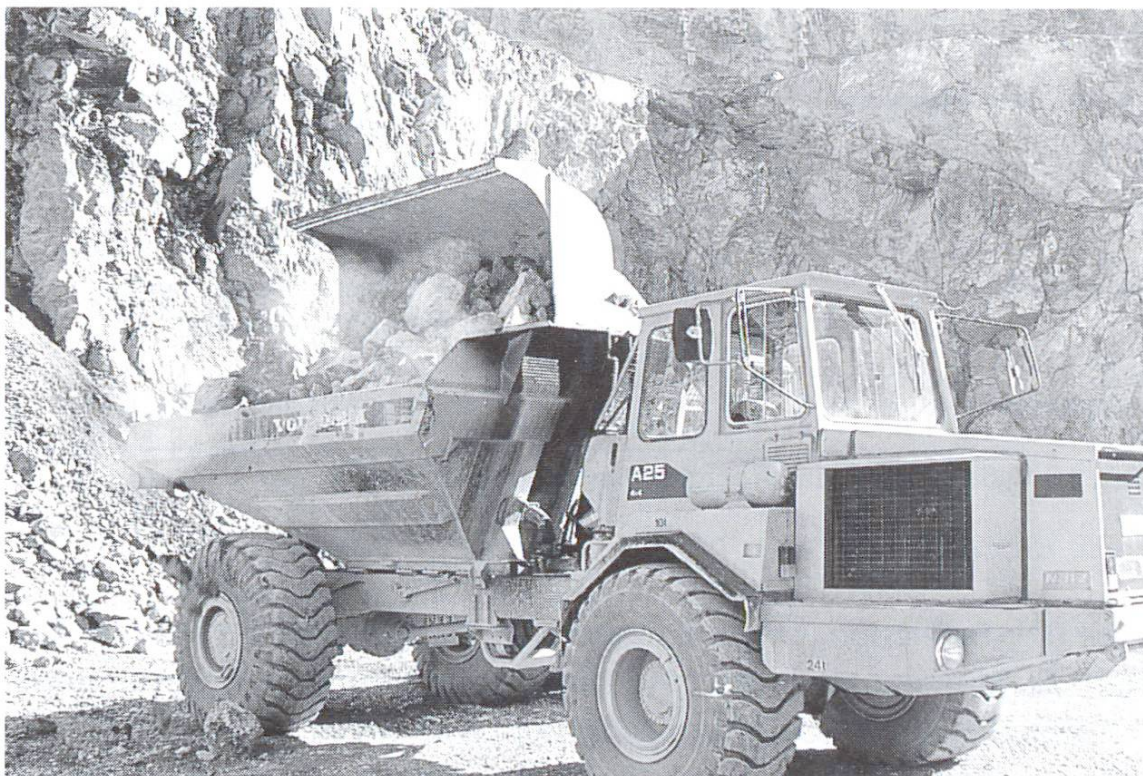
Muldenkipper zum Transport von Kalkstein.

Berater der TFB werden von Zeit zu Zeit mit Problemen konfrontiert, die auf Missverständnisse bei der Anwendung von Kalk zurückzuführen sind. Genauer ausgedrückt geht es darum, dass es sich bei den Bindemitteln, die im normalen Sprachgebrauch als «Kalk» bezeichnet werden, um recht unterschiedliche Produkte handeln kann [1]. In der Norm SIA 215 [2] wird zwischen hydraulischem Kalk und verschiedenen Formen von ungelöschtem und gelöschtem Weiss-