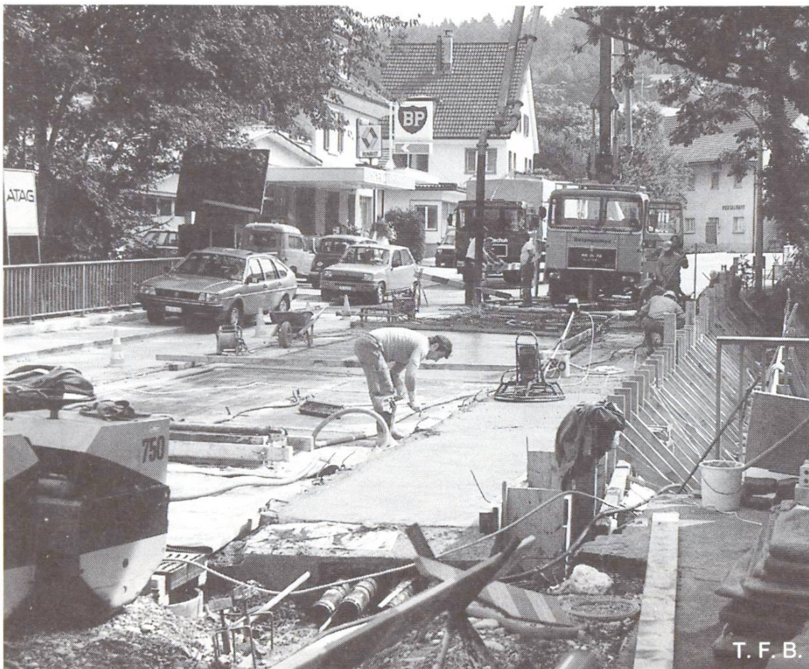
Abb. 5 Brücke über den Erzbach (AG/SO). Kantonsstrasse im Einbahnverkehr. Betonieren der 2. Etappe mit anschliessender Vakuumbehandlung.

phase keinesfalls mehr austrocknen, da er das verbleibende Wasser zur Hydratation benötigt. Die Nachbehandlung hat deshalb einzusetzen, sobald der Beton ansteift, d.h. trittfest ist. Verschiebt man sie auf den folgenden Tag, so kann es bereits zu spät sein (z.B. einsetzender Föhnwind während der Nacht). Geeignet ist das Abdecken mit Plastikfolien oder mit Isoliermatten. Bei Verwendung eines Curing compound ist nur ein gleichmässiges Aufbringen wirksam, was aus praktischen Gründen nicht immer durchführbar ist.