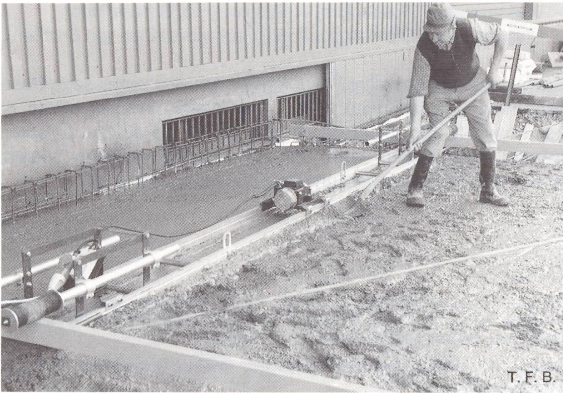
Abb. 1 Höhengenaues Abziehen mit Oberflächenvibrator.