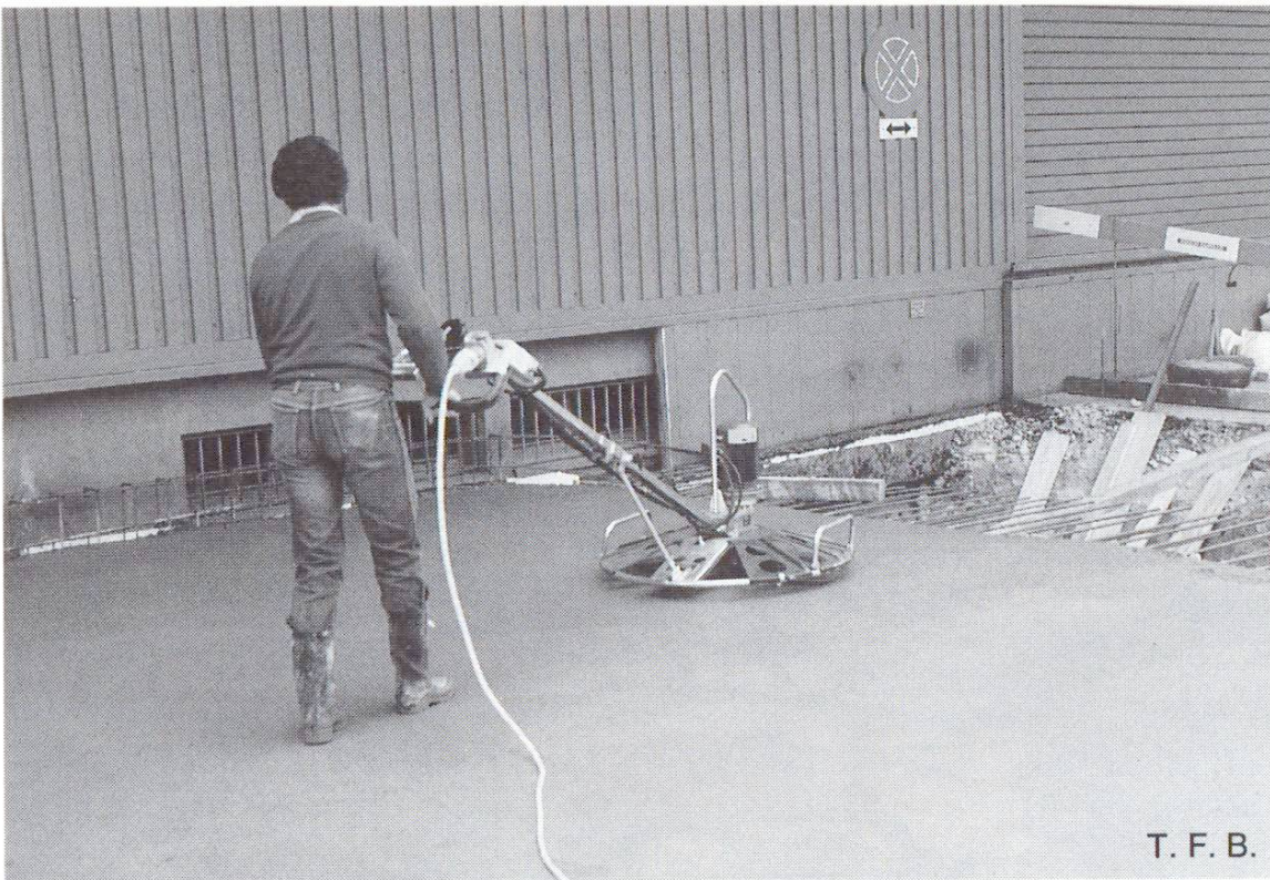
Abb. 3 Oberflächenfertigung. Hier: Abglätten mit Flügelglätter.