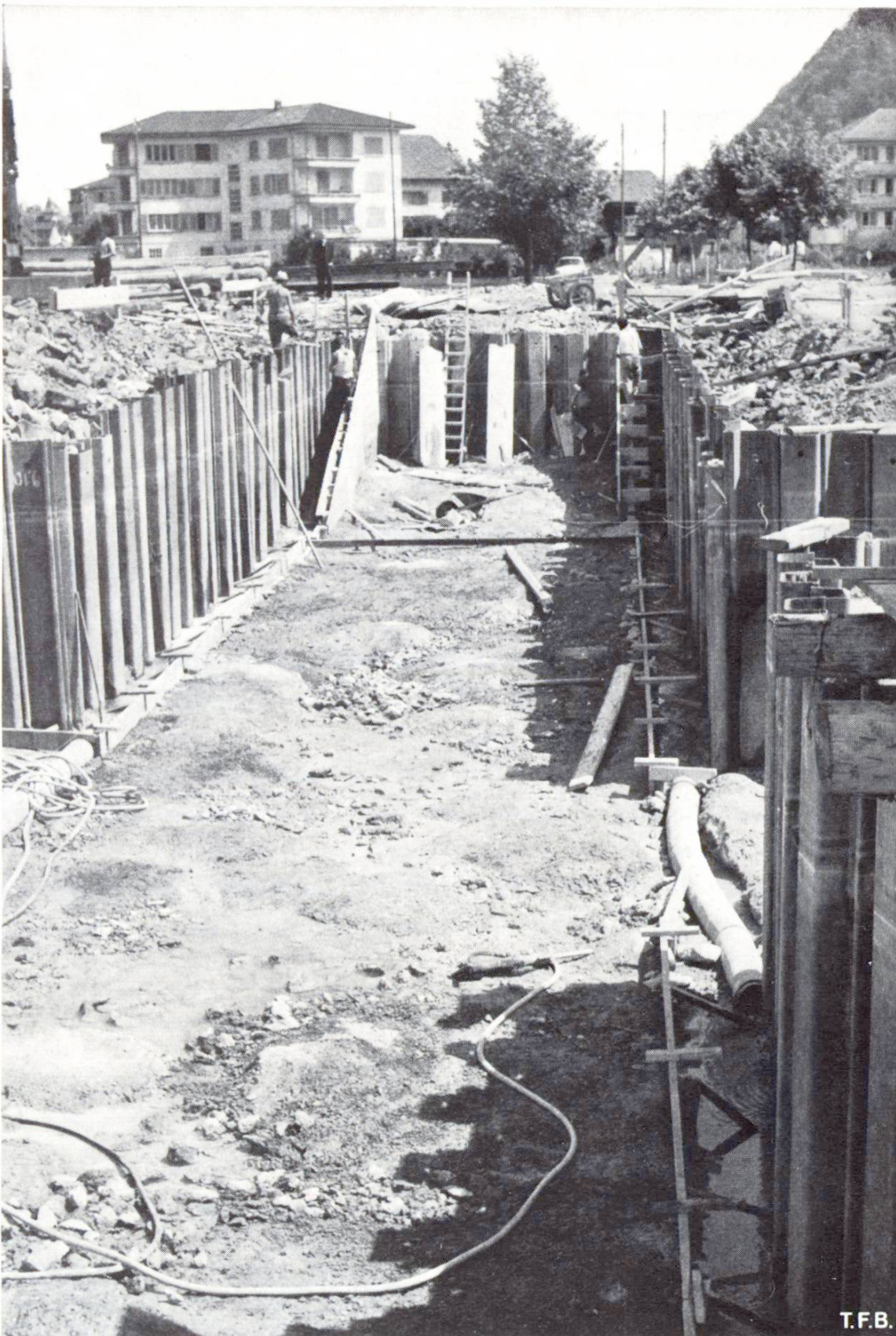
Abb. 7 Fussgänger-Unterführung: Aufsicht auf Unterwasserbetonplatte, Unebenheit etwa 20 cm.