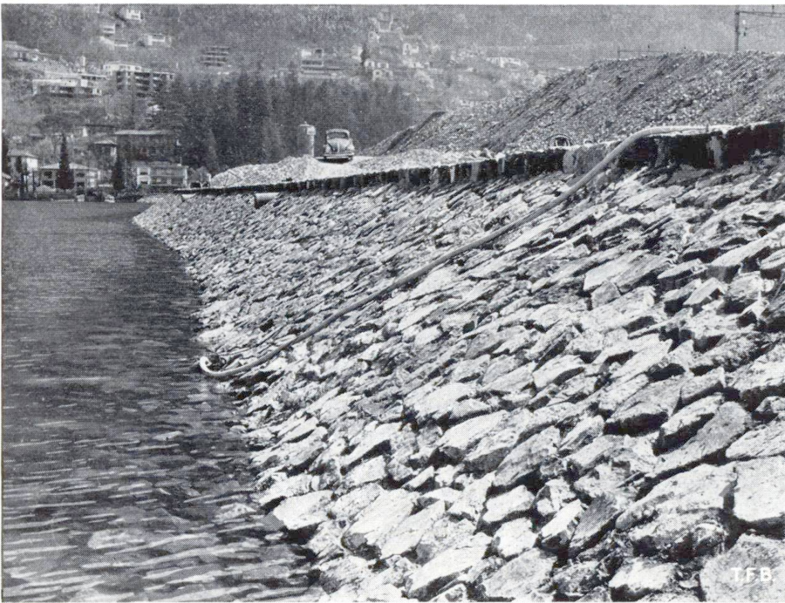
Abb. 6 Die Uferverkleidung aus versetzten Bruchsteinen, die nicht bis zur Oberfläche verfugt sind, fügt sich gut in das Landschaftsbild ein.

hier aus gelange der Mörtel über Sekundärpumpen und weitere Förderleitungen bis zur jeweiligen Einbaustelle auf der Böschung. Die an den Schlauchenden montierte Klemmvorrichtung ermöglichte den Mörtelausstoss je nach Fugentiefe bzw. -breite so zu begrenzen, dass beim Vermörteln kein Verspritzen der Steinoberfläche eintrat und zeitraubende Nacharbeiten vermieden wurden. Ausserdem konnte auf diese Weise der von der Bauleitung angestrebte Vermörtelungsgrad, etwa 4 cm unter Oberkante Steinpackung, zufriedenstellend eingehalten werden. Es handelt sich dabei vor allem um eine Hilfsmassnahme für Ertrinkende, die sich an den aus dem Mörtelbett hervorstehenden Steinen in der Böschungsoberfläche notfalls festklammern können.