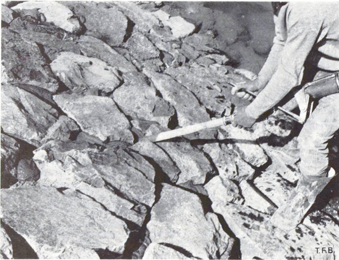
Abb. 3 Vermörtelung über Wasser.

Dabei war vor allem ausschlaggebend, dass das Steingerüst des Böschungsfusses unter Wasser, trotz des zeitweiligen Wellenschlages, mit Colgrout einwandfrei injiziert werden konnte und sich dieser Mörtel auch unter Wasser nicht entmischte . Der Colgrout floss infolge der Schwerkraft und seiner Geschmeidigkeit in die Hohlräume um das Steinmaterial und verdrängte das dort vorhandene Wasser.