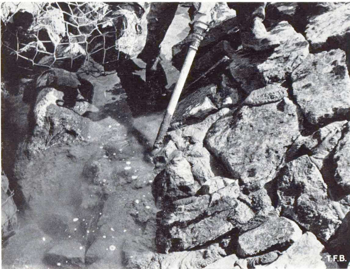
Abb. 4 Vermörtelung unter Wasser.

tenden langsameren Arbeitsfortschrittes gegenüber dem Colcrete-Verfahren abgelehnt. Ausserdem konnte mit dieser Methode der Unterwasserteil der Böschung nicht ausgeführt werden.