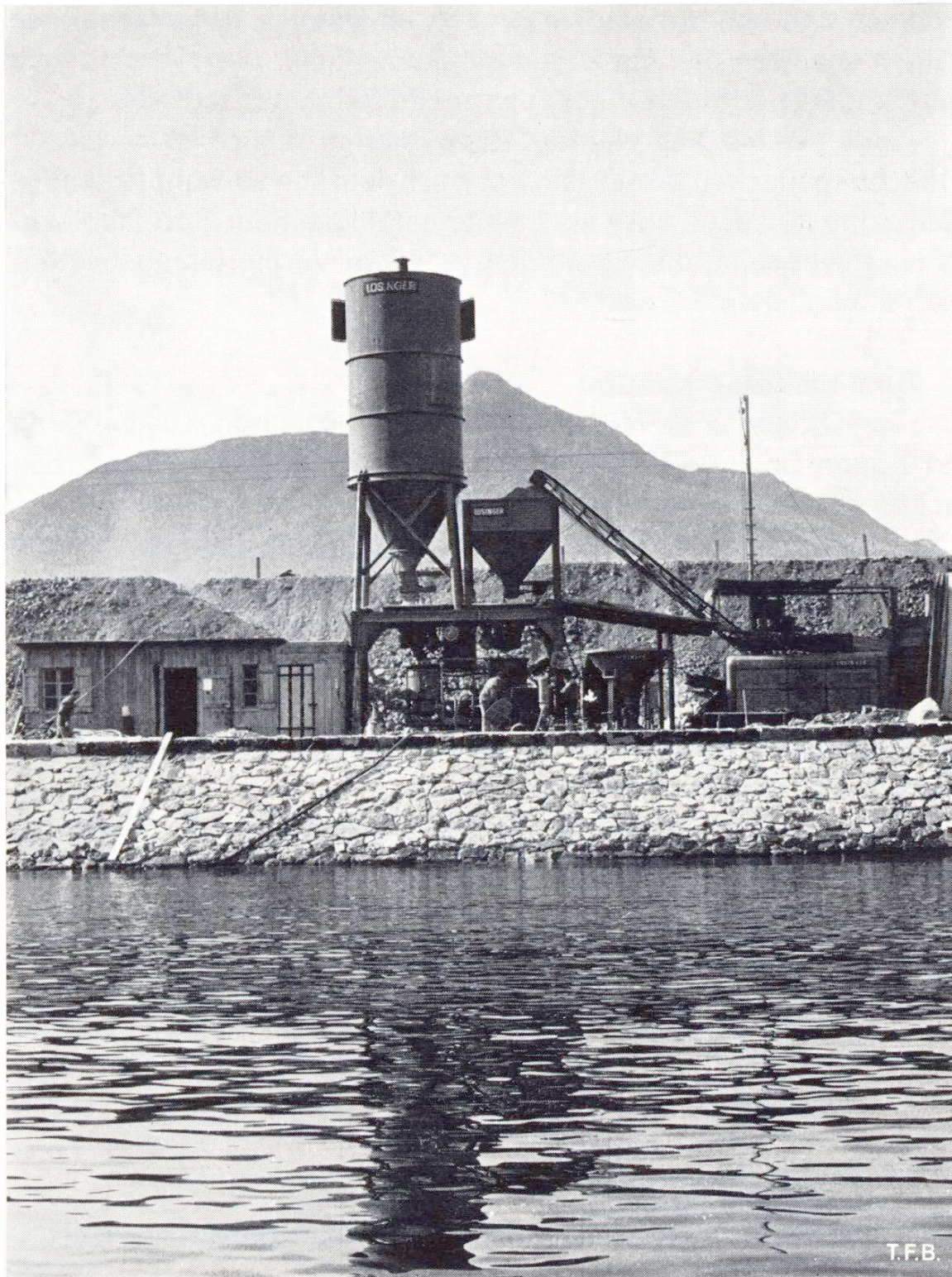
Abb. 2 Aufbereitungsanlage für den Colcrete-Mörtel mit 350-l-Spezialmischer.