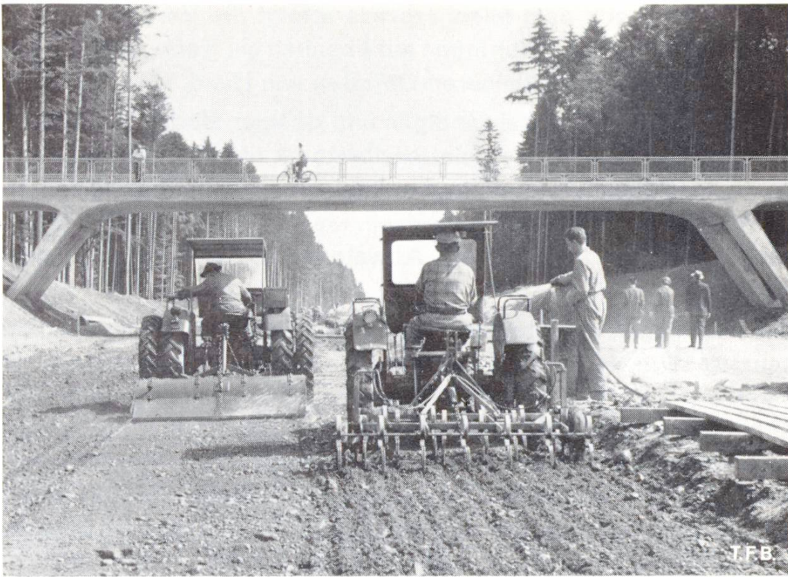
Abb. 5 Rechts: Gerät zum Auflockern des Bodens. Links: Mehrgangmischer zum Einmischen von Zement und Wasser. (N 1: Bern-Zürich, Grauholz).