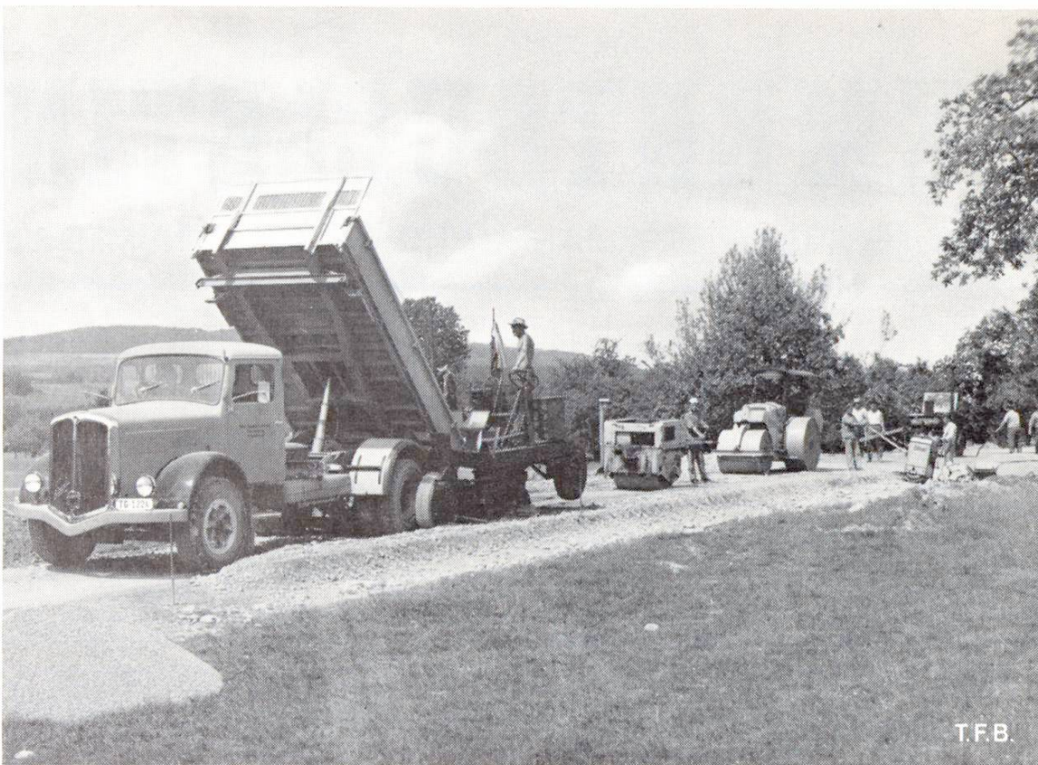
Abb. 1 Wegbau mit zementstabilisiertem Material nach dem Mix-in-plant-Verfahren. Man erkennt von vorn nach hinten: Einfüllen der aufbereiteten Mischung in die Einbaumaschine, Vibrationswalze, Glattwalze, Randverdichtung, bituminöse Oberflächenbehandlung.

Unter der Stabilisierung eines Bodenmaterials mit Zement versteht man die Verfestigung einer Schicht von 10 bis 20 cm Stärke mit Hilfe des genannten Bindemittels und Wasser. Die Hauptziele der Stabilisierung mit Zement sind das «Stabilmachen» gegen Wasser und Frost, bessere Verdichtung und entsprechend bessere Festigkeit des Materials. Daraus ergibt sich eine wesentliche Erhöhung der Tragfähigkeit und eine sehr gute Lastverteilung auf die darunterliegenden Schichten.