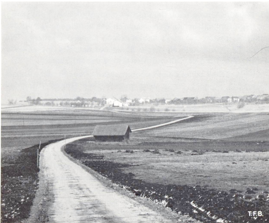
Abb. 6 Zementstabilisierter Feldweg.

Im Güter- und Waldwegbau mit geringen Verkehrsfrequenzen, jedoch mit immer höheren Achslasten vermögen die alten wasser- gebundenen Schotterstrassen nicht mehr zu genügen. Ihr jährlicher Unterhalt ist auf die Dauer bedeutend unwirtschaftlicher als eine etwas teurere aber dafür solide Bauweise. Als Ergänzung des Beton-Güterwegbaues (s. CB 1960/10) wird deshalb für sekundäre Wege die Zementstabilisierung angewendet (Abb. 6). Sie bildet die eigentliche Tragschicht mit oft nur geringer Unterkofferung. Sehr oft besteht die Möglichkeit, lediglich den alten Strassenkörper zu stabilisieren. Bei Neuanlagen wird meistens Wandkies verwendet. Wegen der geringeren Abriebfestigkeit werden diese Wege zu-