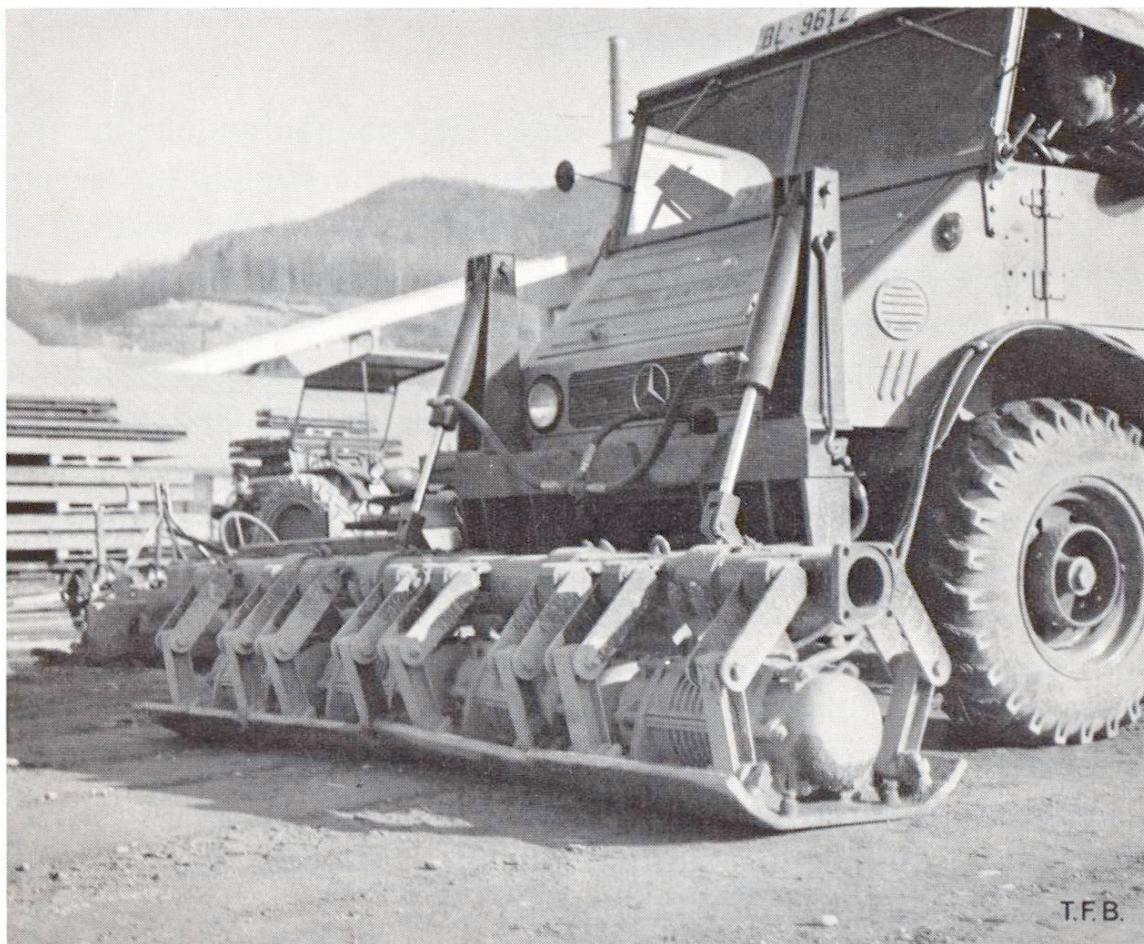
Abb. 4 Mehrplattenvibrator.

Als Abschluss der Stabilisierungsarbeit folgt die für die Qualität sehr wichtige Nachbehandlung, welche zu verhindern hat, dass die stabilisierte Schicht während der ersten 7 Tage des Erhärtens austrocknen kann. Dies kann durch ständiges Bewässern, durch eine nasse Sandschicht oder durch einen Film von wässriger Bitumenemulsion, der unmittelbar nach dem Verdichten auf das noch feuchte Material gespritzt wird, erreicht werden. Das letztgenannte Verfahren ist dabei das wirtschaftlichste.