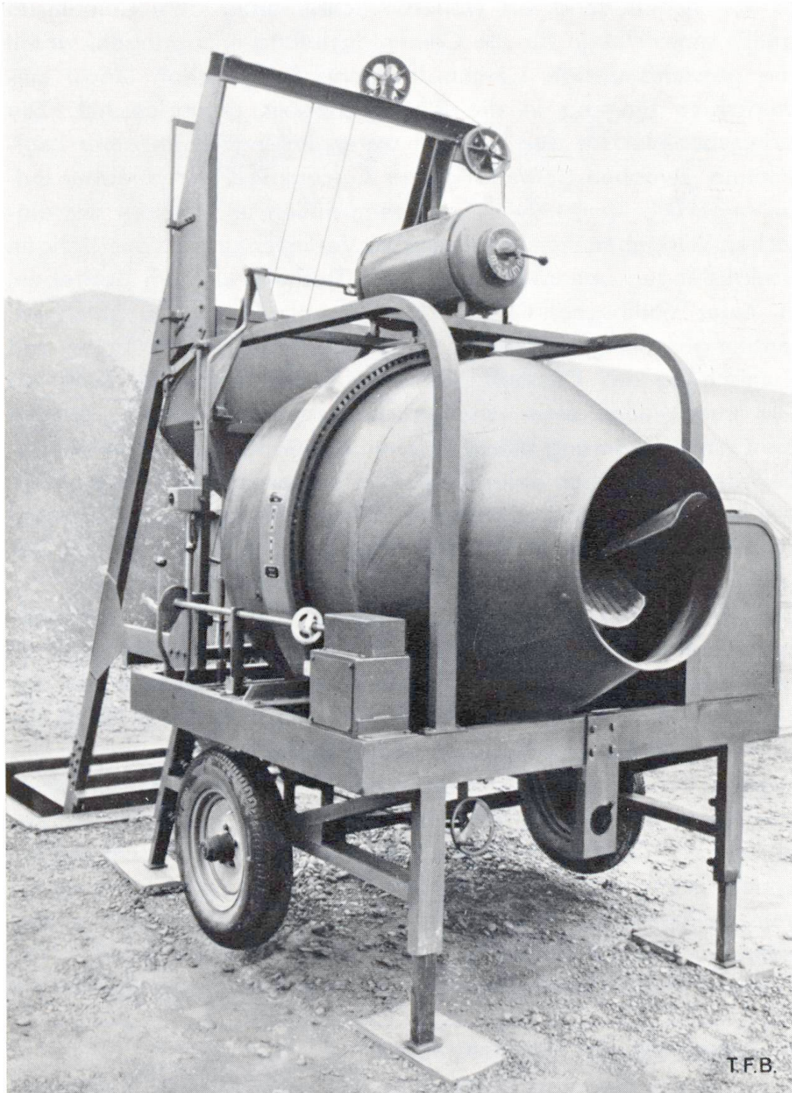
Abb. 3 Reversiermischer für kleinere Baustellen (Freifallmischer mit Entleerung durch Änderung des Drehsinnes der Trommel)

7 tionäre Betonmaschinen entworfen und eingeführt werden. Es ist aber offensichtlich, dass zukünftig mehr und mehr auch die Kleinsten davon erfasst werden. Neuerungen für die Produktions- und Qualitätsverbesserungen, die sich heute auf mittleren und grossen Baustellen bewähren, werden morgen im Prinzip auch auf der Kleinbaustelle eingeführt sein. Der Drang nach Rationalisierung ist überall gross.