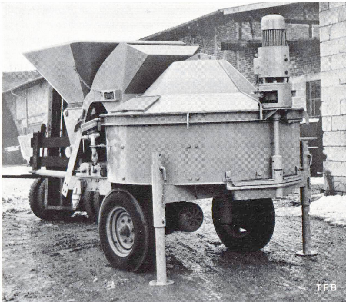
Abb. 2 Turbomischer mit Aufzugskübel und Einfülltrichter. Am Mischgefäß vorn erkennt man den mit einem besonderen Elektromotor betätigten Segmentschieber für die Entleerung

Der Turbomischer (Abb. 2) besteht im Prinzip aus einem runden Gefäß mit ebenem Boden, in welchem sich ein Rührwerk mit verschieden ausgebildeten Armen mit ca. 35 U/Min. dreht. Durch die rasche, sehr intensive Bearbeitung des Mischgutes wird bei relativ kurzer Mischzeit ein qualitativ hochstehender Beton von bester Verarbeitbarkeit erzeugt. Der neue Mischertyp wird mit den üblichen Dosiergeräten beschickt und durch eine Segmentöffnung am Boden des Mischgefäßes entleert. Gefäß und Mischarme sind mit Verschleissplatten und -ringen ausgerüstet, die sich