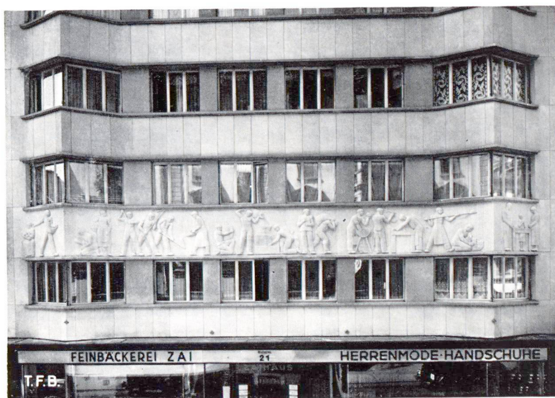
Abb. 1 Fassadenverkleidung und Reliefband aus Kunststein