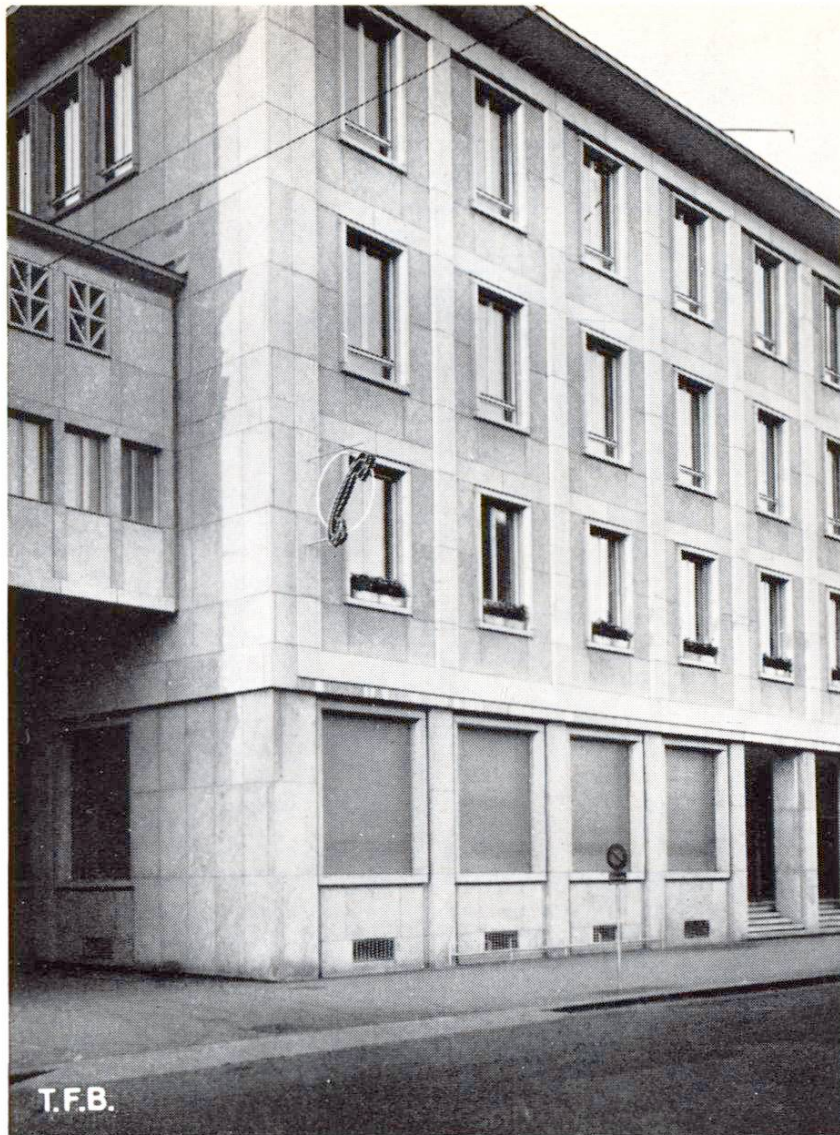
Abb. 6 Verblendung des Telephon-Verwaltungsgebäudes in Luzern. Die Skelettbauweise wurde durch die Gestaltung der Fassade bewusst hervorgehoben. Ausführung in Kunststein

des Rohbaues in genauesten vertikalen Abständen in die Mauer eingefügt werden.