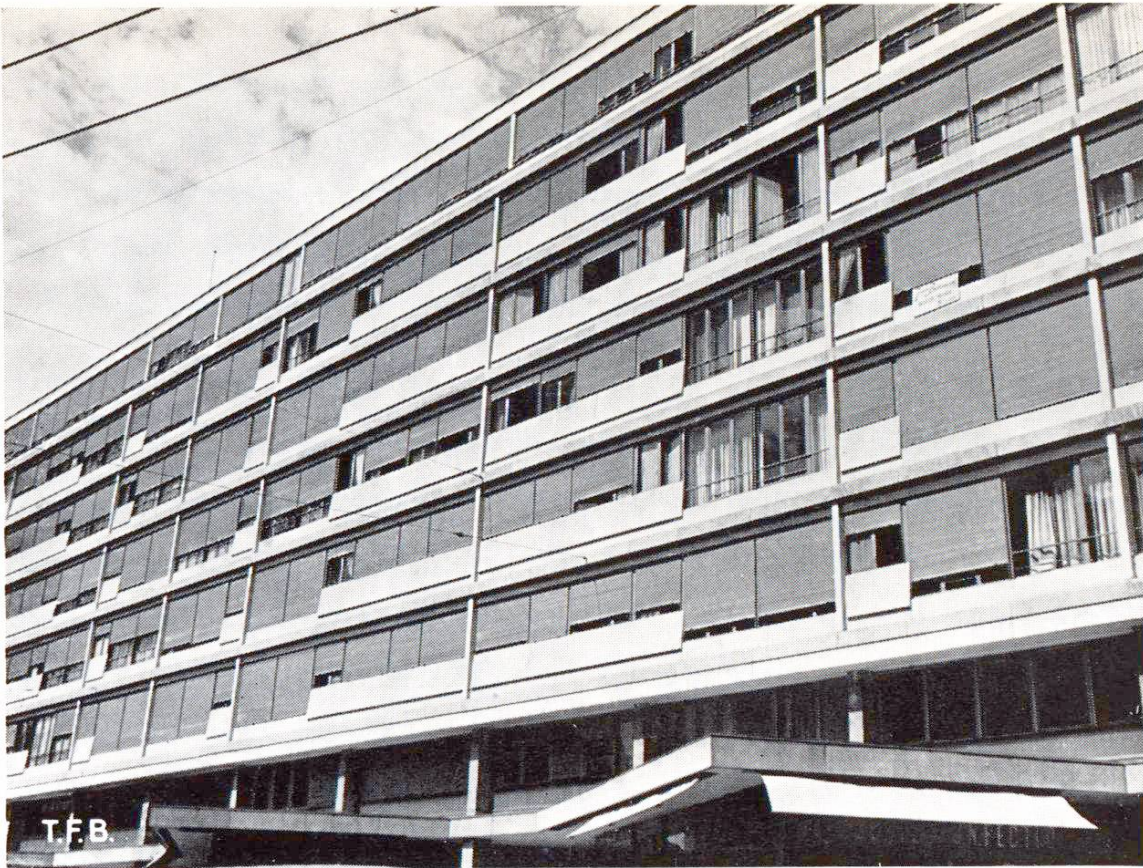
Abb. 7. Modernes Geschäfts- und Wohnhaus in Genf. Die Fensterbrüstungen bestehen aus schindelartig angebrachten Kunststeinplatten. Die Platte als Bauelement konnte hier in ihrer ganzen Form sichtbar gemacht werden

welches vor dem Ansetzen der Platte schon aufgetragen werden kann. Als Bindemittel dient Portlandcement, hydraulischer Kalk oder ein Gemisch der beiden. Hydraulischer Kalk wird zur Verbindung gewisser Natursteine verwendet, welche durch Cement etwelche Schädigungen und Verfärbungen erfahren können.