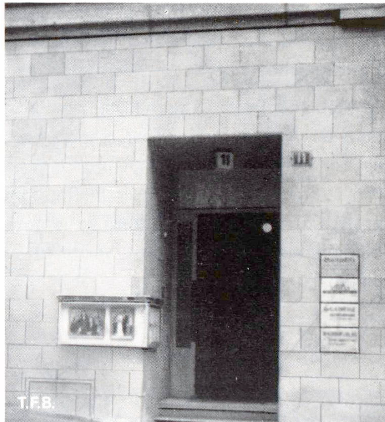
Abb. 3 Ältere Plattenverkleidung durch den Fugenschnitt ein echtes Mauerwerk vortäuschend. Der Widerspruch fällt beim Betrachten des Sturzes über dem Eingang sofort auf

Bei der Verblendung mit Werksteinen liegt die Versuchung nahe, durch verbandsmässigen Fugenschnitt Quader- oder Mischmauerwerk vorzutäuschen. Beispiele hiezu findet man in den Anfängen dieser Bauweise (Abb. 3). Die falsche Anwendung scheint aber heute überwunden, denn die moderne Baukunst hat solche Maskeraden nicht nötig. Sie erstrebt mit Recht die Gestaltung mit reinen, wesenseigenen und zweckmässigen Formen. So werden sich bei einer äusseren Verkleidung meist auch vier Plattenecken an einem Punkte treffen, wie dies auch beim inneren Wandplättlibelag üblich ist. Neueste Bestrebungen gehen auch dahin, die Platten als solche räumlich in Erscheinung treten zu lassen (Abb. 7).