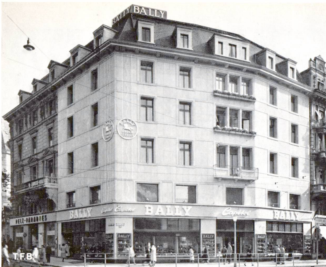
Abb. 2 Mit Natursteinplatten umgestaltete Fassade. Man beachte die etwas vorspringenden, waagrechten Bindersteine. Links ein älteres Gebäude in Mischmauerwerk

Die Verblendung von Fassaden mit Natur- oder Kunststeinplatten bezweckt die Verschönerung des Gebäudes und den Schutz des tragenden Mauerwerks gegen Witterungseinflüsse. Die versetzten Werksteine übernehmen die Aufgaben, die sonst dem Verputz zufallen, sind aber in vermehrter Masse ein architektonisches Ausdrucksmittel. Durch geeignete Wahl von Material, Farbe und Anordnung kann die Fassade eines Gebäudes charakteristisch gestaltet werden. Ohne andere Bauweisen vortäuschen zu wollen, verleiht die Plattenverblendung einem Gebäude ein solides, monumentales Aussehen.