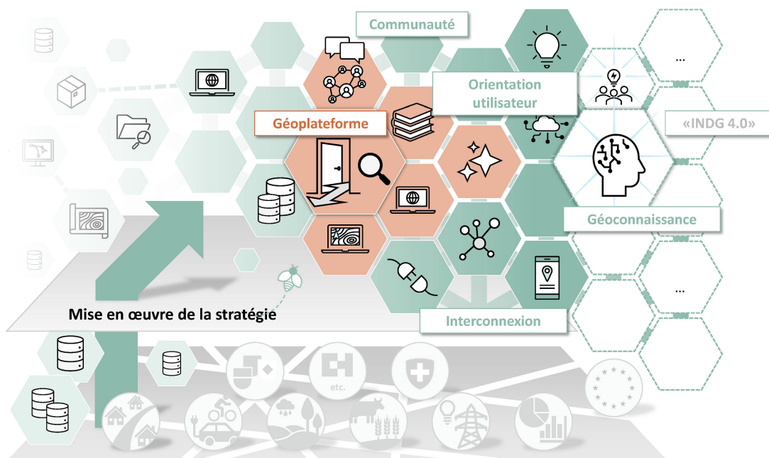
Figure 1: «paysage de développement» de l'INDG Suisse (l'explication d'une bonne partie des symboles se trouve sur les figures suivantes)

Les utilisateurs sont en mesure d'obtenir directement des réponses concrètes à toutes leurs questions en lien avec le territoire, de manière ciblée, au niveau adéquat et en rapport avec leurs besoins. Ils accèdent dans ce cadre à des prestations de services et à des produits en réseau, interagissant avec des interfaces intelligentes et prenant en charge des solutions génératives. Les échanges sont intenses au sein de la communauté et de nouvelles applications sont développées par le biais d'innovations, d'algorithmes et sur la base de don-