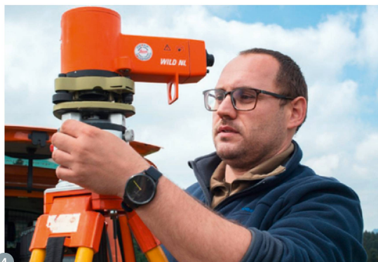
Figure 4: centrage au plomb optique. Le centrage garantit que l'instrument de mesure est mis en station à la verticale du point fixe.