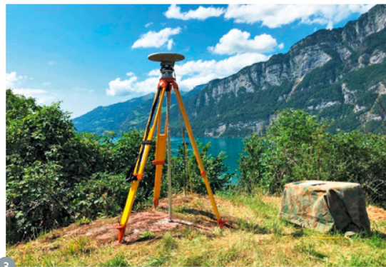
Figure 3: mesure GNSS statique sur le point de densification MN95 de Murg, dans le cadre de la campagne GNSS de 2022