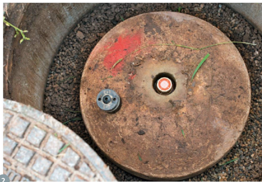
Figure 2: point fixe planimétrique type en plaine. La calotte (à gauche) est dévissée et une cible de centrage est montée sur la cheville mise à nu. Dès que la possibilité se présentait (ce qui n'était visiblement pas le cas ici), les points étaient directement scellés dans la roche, sans recourir à un socle en béton.