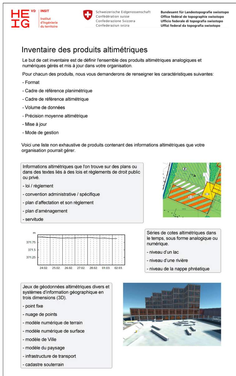
Figure 3: Extrait du questionnaire sur les informations altimétriques existantes en Suisse

Pour obtenir un inventaire le plus exhaustif possible, le questionnaire, disponible en allemand, français et italien, a été envoyé à travers toute la Suisse aux organisations et particuliers qui couvrent les principaux gestionnaires et utilisateurs d'informations altimétriques dans des fonctions diverses (autorités, administrations publiques, gestionnaires du territoire et d'infrastructures techniques les plus diverses, planificateurs, bureaux d'ingénieurs, etc.).