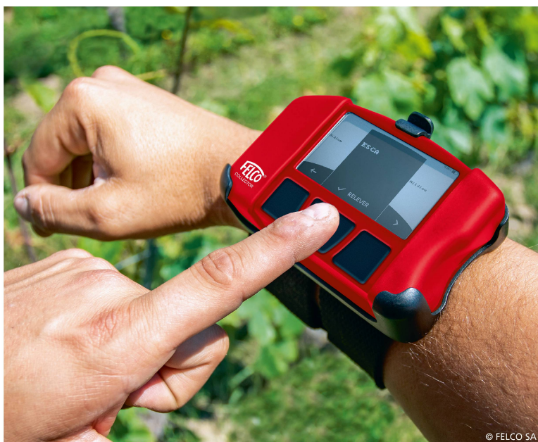
Le bracelet connecté

Une entreprise familiale qui fabrique des outils de taille et de coupe depuis 75 ans vient de lancer un bracelet connecté géolocalisé pour les professionnels de la viticulture avec de la technologie intelligente du monde du foot. Quels ont été les ingrédients pour effectuer ce virage numérique?