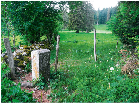
Figures 2.1 à 2.4: Exemples de bornes-frontière typique de la région.