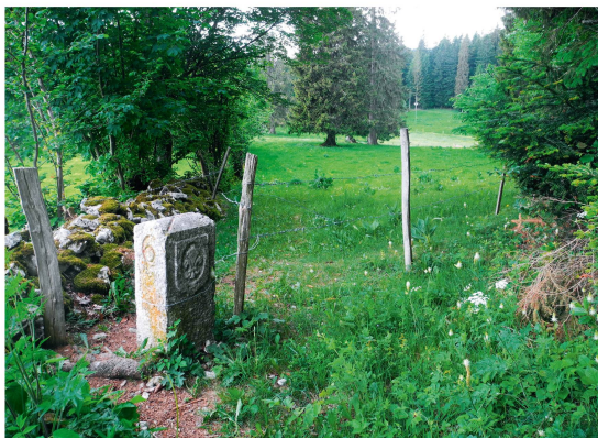
Figures 2.1 à 2.4: Exemples de bornes-frontière typique de la région.