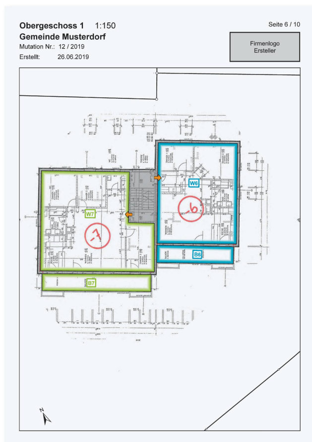
Figure 3: plan d'un étage