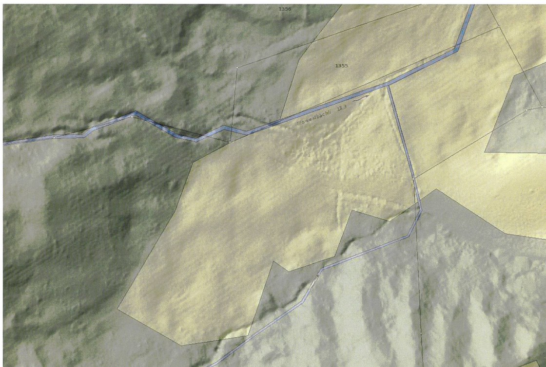
Figure 3: en forêt aussi, les différences au niveau des cours d'eau peuvent être décelées clairement grâce à l'estompage du relief fourni par le MNT.