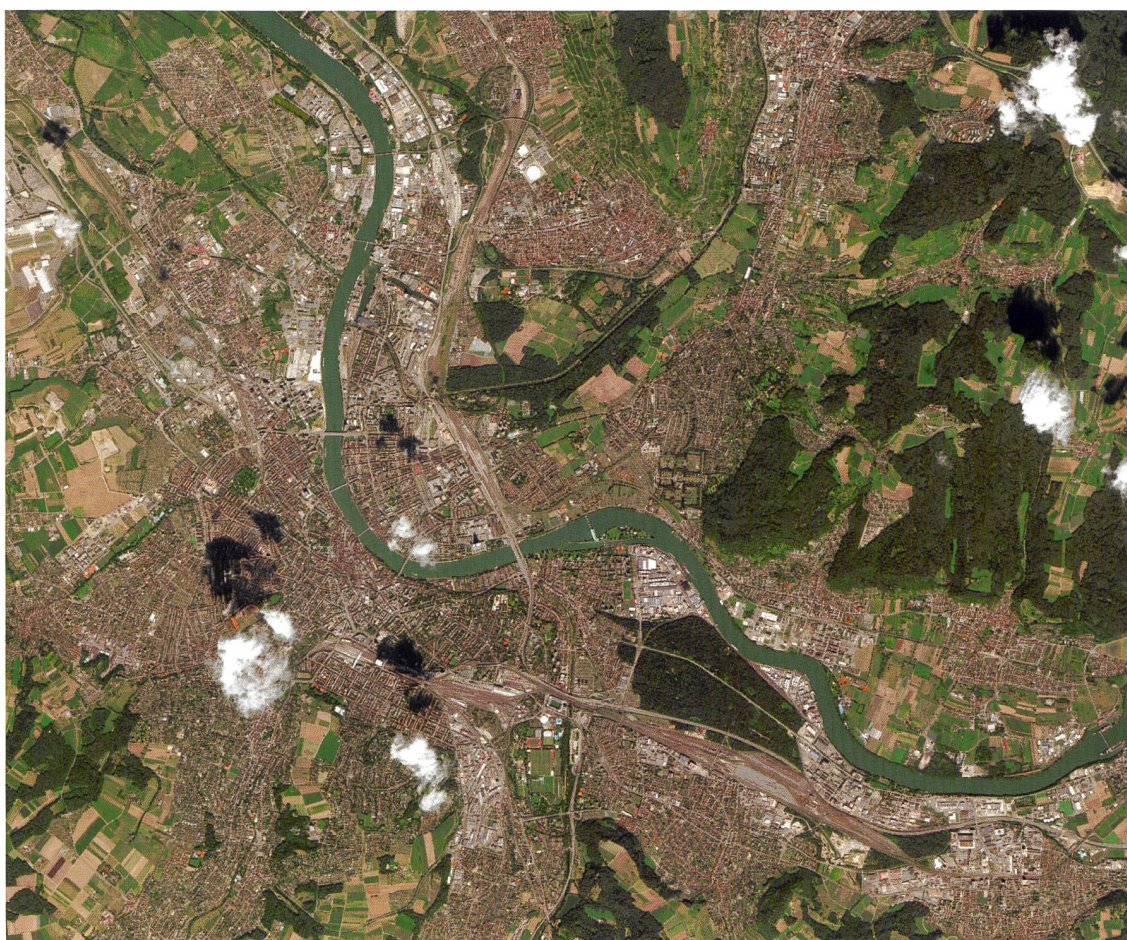
Figure 1: Vue de la région bâloise prise par le satellite Pléiades-1 le 22 août 2016, la commande correspondante ayant été faite la veille. Etant donné la taille (>300 km 2 ) de la zone à couvrir avec une résolution de 50 cm, quelques nuages résiduels subsistent ici ou là.

Le présent article vise donc à informer le lecteur des systèmes d'imagerie satellite à haute résolution les plus récents et des possibilités offertes en lien avec la mensuration officielle (MO). Les retours émanant de clients à la suite de prises de vues spécifiques programmées («taskings») par le NPOC et déjà effectuées sont pris en compte ici. Il s'agit notamment de l'office de la géoinformation du canton de Soleure, de l'office du registre foncier et des mensurations du canton de Bâle-Ville et de la société Trigonet AG.