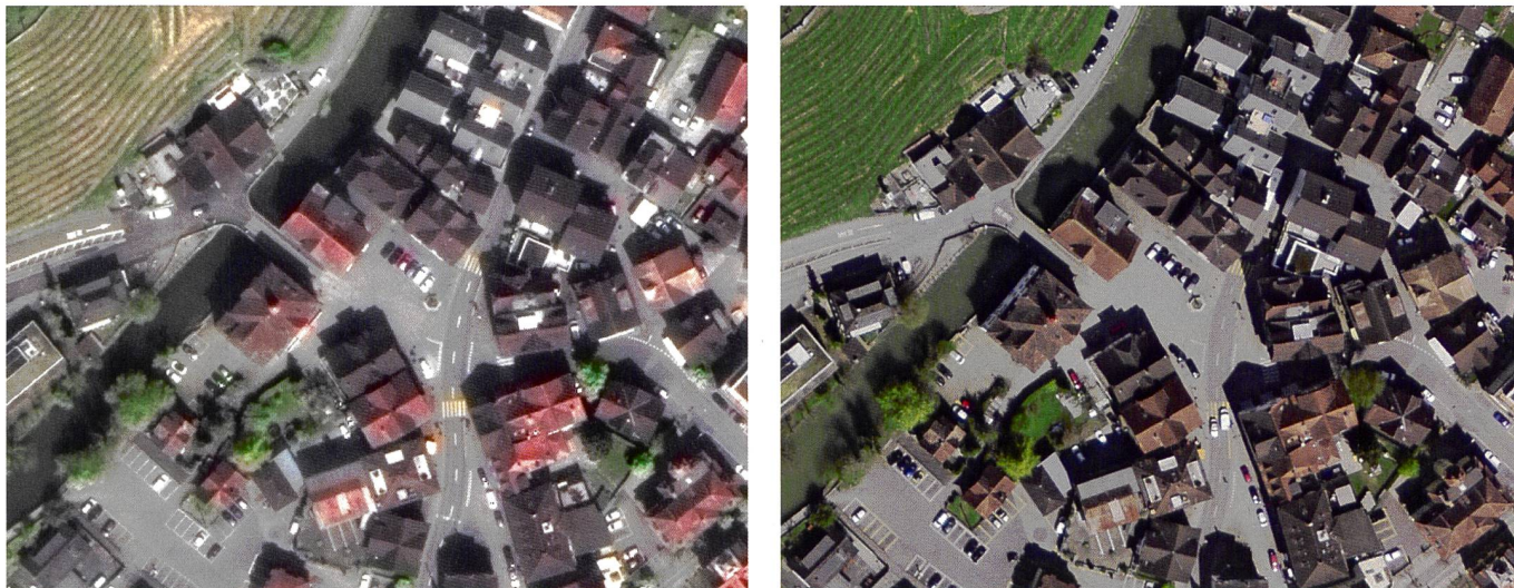
Figure 3: Les vues satellite (à gauche: Sarnen, image WV03 du 30 avril 2016, GSD = 32 cm) restent d'une qualité légèrement inférieure à celle des photos aériennes de référence (à droite: SWISSIMAGE, vue avec GSD = 25 cm) en termes de netteté, de contraste et de restitution des couleurs.