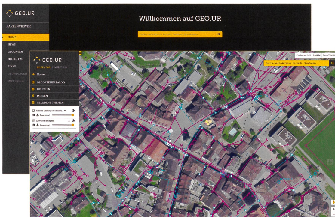
Figure 1: Géoportail GEO.UR

les données projetées du cadastre RDPPF, sur le modèle zurichois.