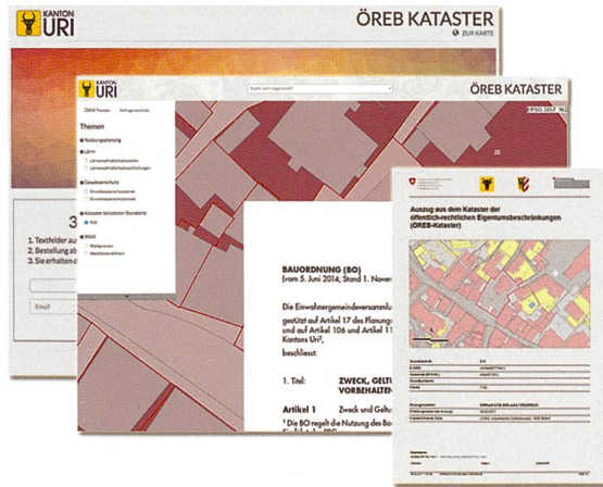
Figure 2: Prototypes du portail cantonal du cadastre RDPPF et d'un extrait de ce cadastre

tion. L'acceptation du cadastre RDPPF et sa pertinence sont accrues par cette restriction opérée en toute connaissance de cause: seules sont proposées à l'utilisateur des géodonnées dont l'exactitude a été confirmée dans le cadre d'une procédure contrôlée et dont l'existence se fonde sur des décisions prises par les autorités. Un recouvrement avec d'autres géodonnées issues de GEO.UR n'est pas possible, mais l'utilisateur peut en revanche intégrer les données du cadastre RDPPF dans GEO.UR.