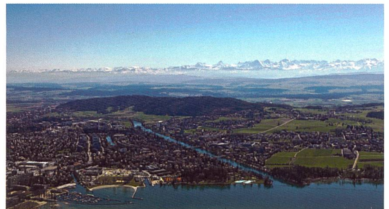
Macolin, où se déroule l'examen d'Etat pour les ingénieurs géomètres, offre une vue somptueuse

Les examens auront lieu à l'Office fédéral du sport à Macolin.