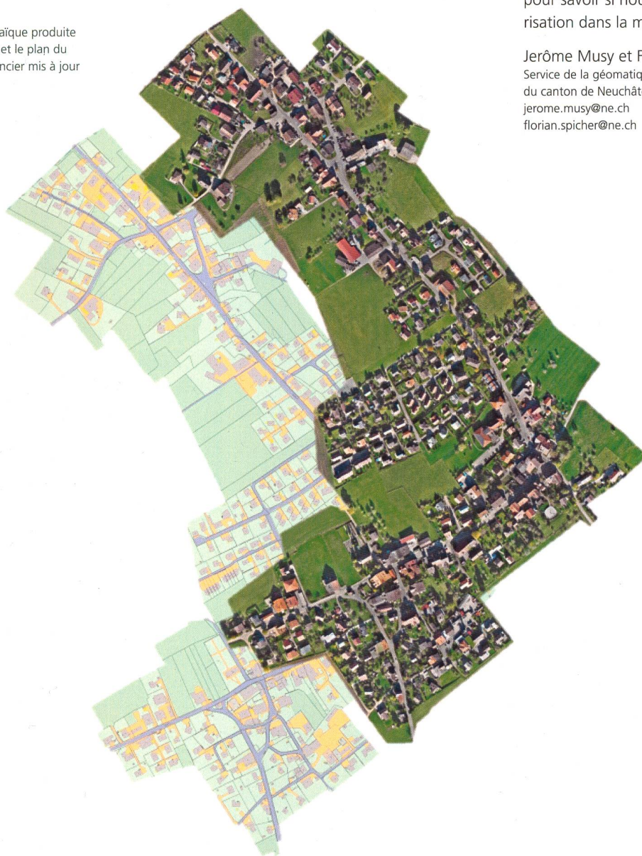
Figure 1: Orthomosaïque produite par drone et le plan du registre foncier mis à jour

Le temps de numérisation par plan folio est de maximum une heure. Ce temps peut être réduit si pendant la pré-analyse un inventaire des zones favorables à la numérisation est établi.