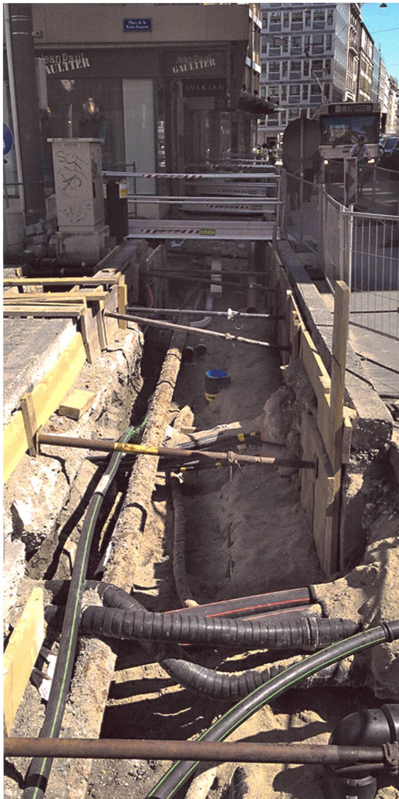
Fig: Complexité du sous-sol

Les données de la mensuration officielle sont à la disposition des releveurs en charge de ces travaux. Il faut toutefois être conscient, au moment du relevé, de la qualité réelle des données de référence utilisées. La fiabilisation d'un relevé de réseau est d'autant plus importante qu'un retour sur le terrain pour y compléter le levé est impossible une fois les conduites enterrées. Toutes les techniques de relevé ne sont pas équivalentes, certaines assurant une précision et une fiabilité nettement supérieures à d'autres. Il faut donc se poser la question de la technique la plus appropriée en fonction des données de référence et des outils à disposition.