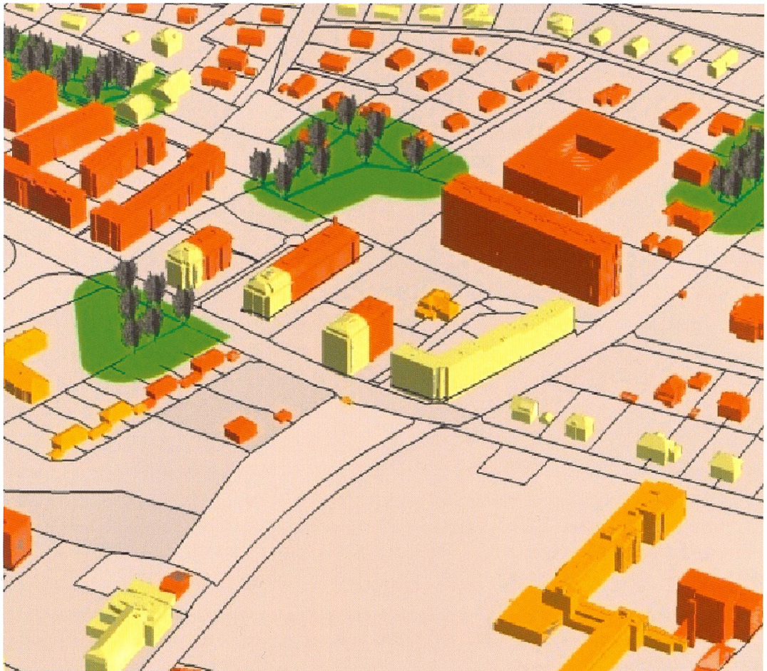
Fig. 2: Projection des degrés de sensibilité au bruit sur le bâti 3D au sein du prototype