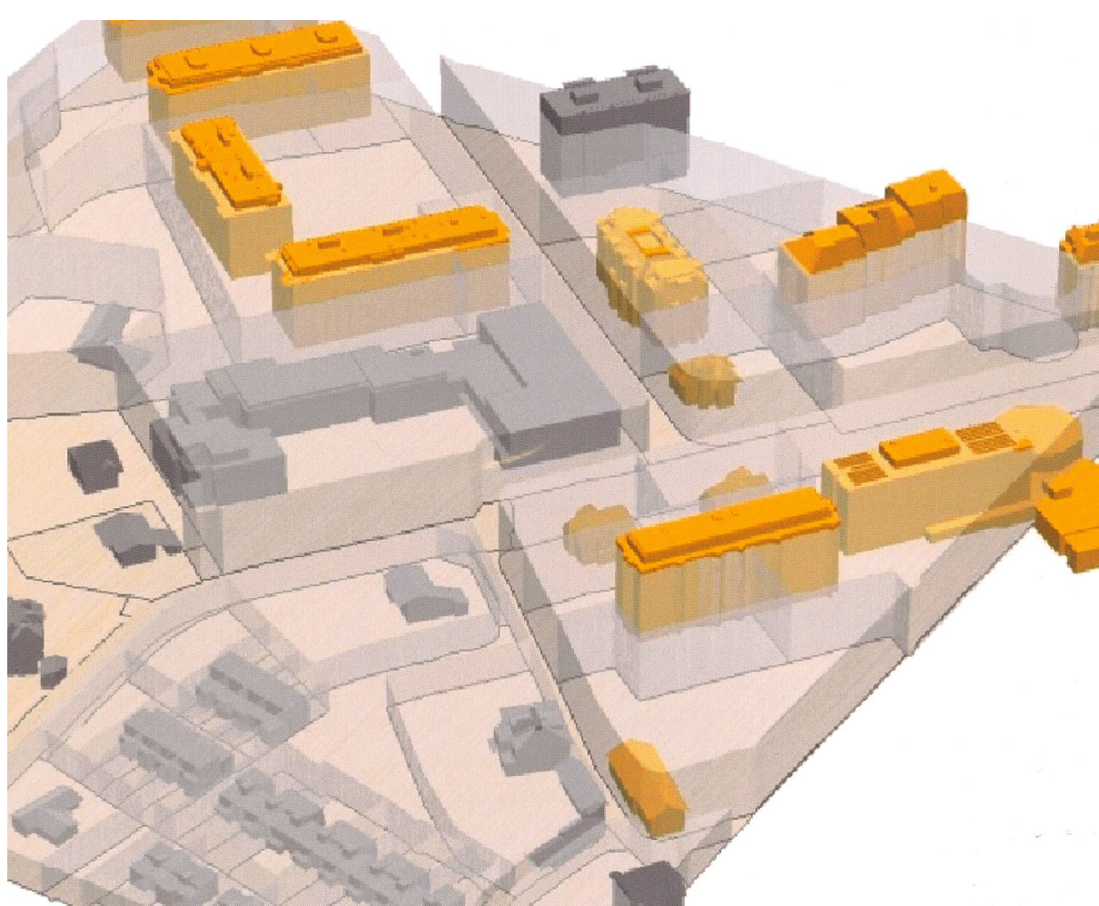
Fig.1: Visualisation du parcellaire en 3D, borné uniquement sur le sur-fonds (application des gabarits des zones d'affectation)

voir assurer une phase de transition entre le passage de la 2D à la 3D. Les différentes hypothèses qui ont été établies s'inscrivent donc dans ce sens.