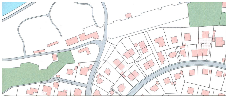
Figure: extrait du WMS «CadastralWebMap»

voit ainsi accru. Une large utilisation signifie également un gain appréciable en termes d'image pour la MO. Il s'agit par ailleurs d'un argument précieux dans les discussions politiques relatives au but et à l'objet de la MO, aidant par ailleurs à justifier les dépenses qui y sont liées.