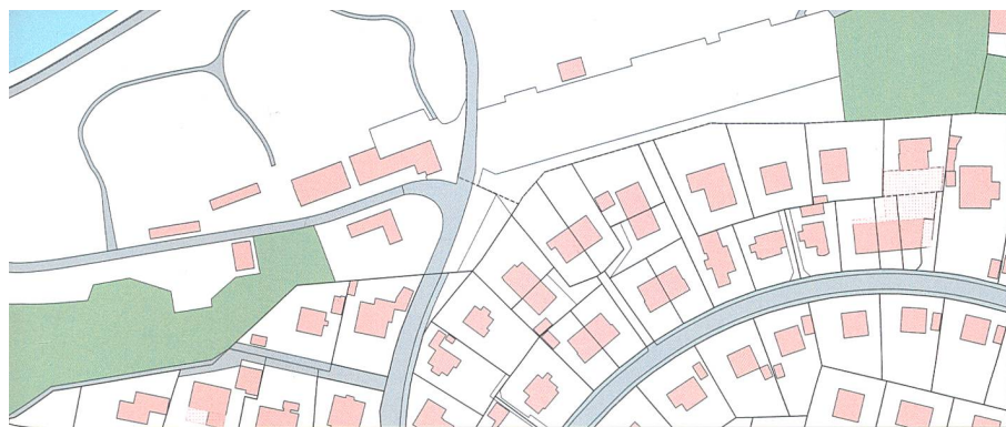
Figure: extrait du WMS «CadastralWebMap»

voit ainsi accru. Une large utilisation signifie également un gain appréciable en termes d'image pour la MO. Il s'agit par ailleurs d'un argument précieux dans les discussions politiques relatives au but et à l'objet de la MO, aidant par ailleurs à justifier les dépenses qui y sont liées.