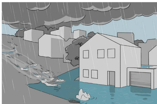
Abb. 1: Lokale Starkregen bringen innert Minuten mehr Wasser, als die Entwässerungseinrichtungen zu fassen vermögen. Zwei von drei Gebäuden in der Schweiz sind potentiell von Oberflächenabfluss gefährdet.

Oft genügen herkömmliche Planungsansätze und die begrenzte Betrachtung einzelner Projektperimeter nicht mehr, um weitsichtige Lösungen zu entwickeln. Der Klimawandel ist ein gutes Beispiel für solch hochkomplexe Veränderungen, die ein interdisziplinäres und auf über-