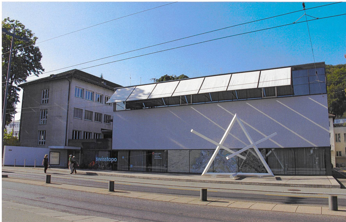
Abb.: Das Bundesamt für Landestopografie swisstopo an der Seftigenstrasse 264, 3084 Wabern

Vor gut einem Monat war es soweit: Die Mitarbeitenden der vormaligen Eidgenössischen Vermessungsdirektion zügelten nach knapp drei Jahren aus den Räumlichkeiten im Eidgenössischen Institut für Metrologie METAS am Lindenweg 50 in Wabern wieder zurück an die Seftigenstrasse 264, an den Hauptsitz des Bundesamtes für Landestopografie swisstopo.