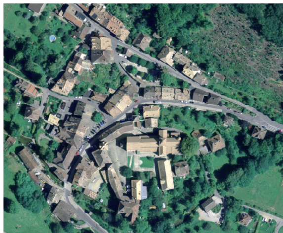
Fig. 246 Plan cadastral (éch. 1:2000) et vue plongeante sur le site.