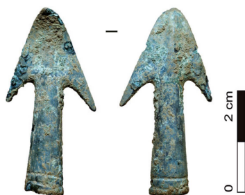
Fig. 147 Rances CVS 1979. Pointe de flèche à douille en bronze.

Il est intéressant de noter qu'il était associé dans ce même horizon à trois autres pointes de flèche en métal à pédoncule 96 . Ces objets ne donnent pas d'indication chronologique précise. L'apparition des modèles à douille peut techniquement être contemporaine des pointes de lance qu'on retrouve dès le BzA2b, par exemple dans le dépôt de Sigriswil BE Ringoldswil 97 , et ce type va perdurer jusqu'à la fin de l'âge du Bronze.