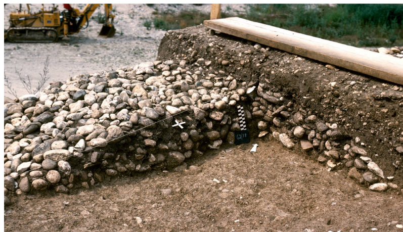
Fig. 40 Rances CVN 1976.

A. Vue générale de la nécropole du Haut Moyen Âge.