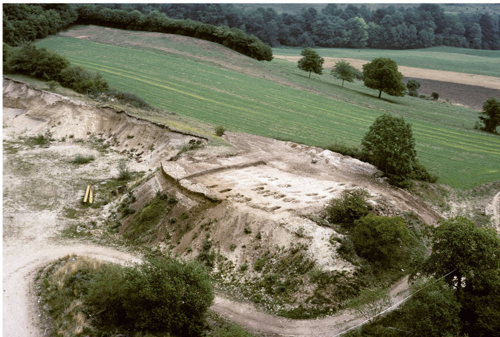
Fig. 39 Rances CVN 1976. Vue aérienne de la nécropole du Haut Moyen Âge avec, à l'arrière-plan, l'emplacement des villages proto-historiques.