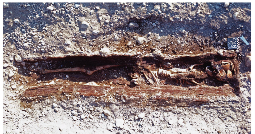
Fig. 41 Rances CVN 1976. Vue des tombes 42 (A) et 55 (B) (photos Département d'anthropologie, Genève).