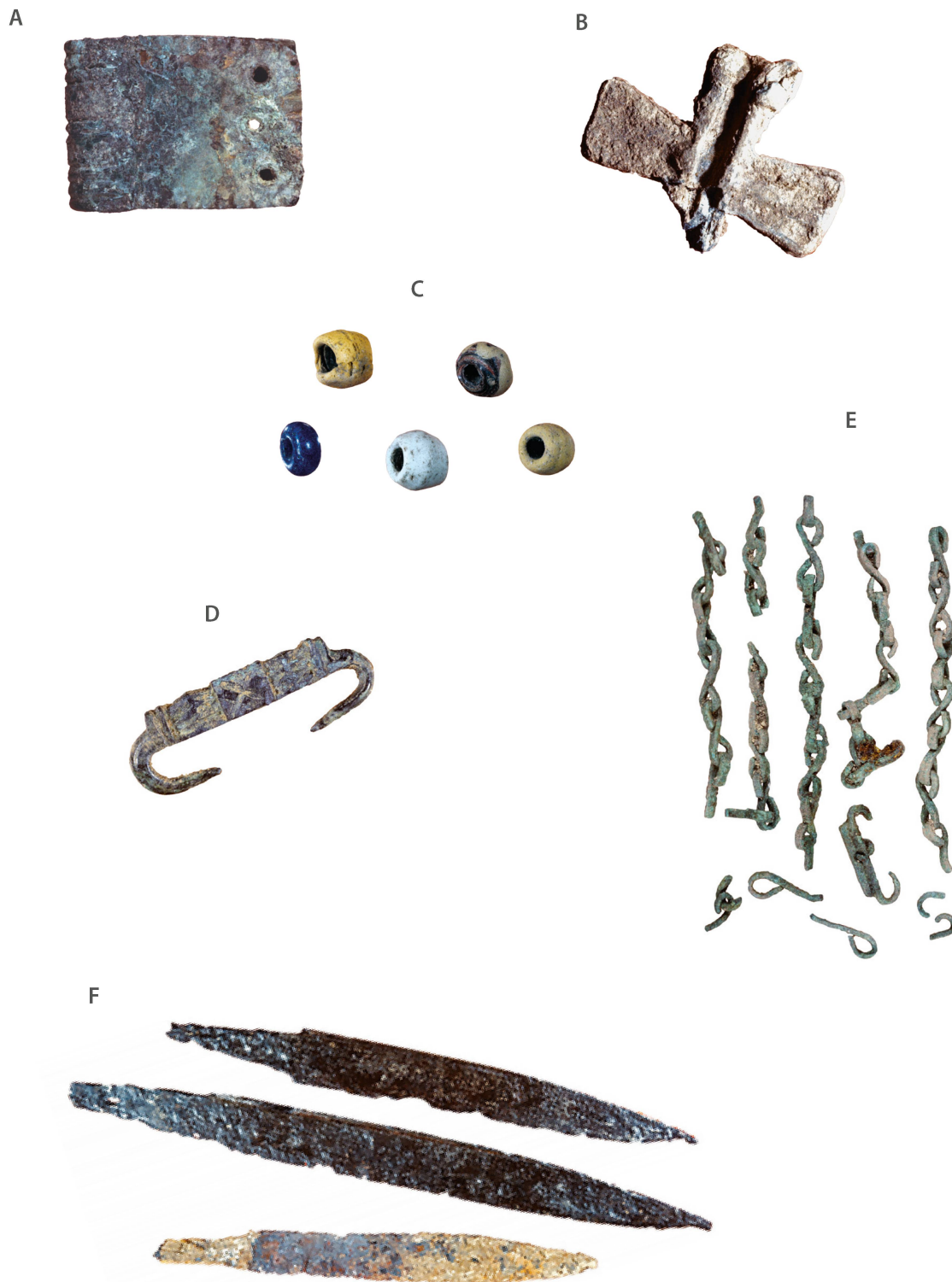
Fig. 43 Rances CVN. Choix de mobilier découvert dans la nécropole. A. Plaque de ceinture en bronze avec traces d'oxyde de fer de la tombe 27. B. Croix en argent ou en plomb de la tombe 28. C. Perles en verre de la tombe 28. D. Agrafe à double crochet en bronze de la tombe 28. E. Chaînette et agrafe à double crochet en bronze de la tombe 67. F. Scramasaxes en fer provenant de tombes détruites. Sans échelle.