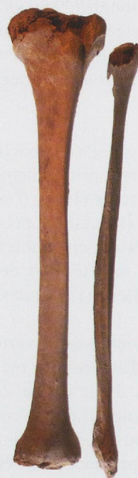
Fig. 14 Lot problématique découvert en 2014 à l'UNIGE. Son rattachement au site de La Tène est hypothétique et repose sur une étiquette écrite par Paul Vouga: « Les 3/4 à partir du fond. 1er trou de La Tène ». L'ambiguïté du texte ne permet pas de retenir ce lot dans le corpus genevois.