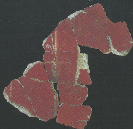
Motif de candélabre grêle dans la décoration du péristyle méridional de la pars urbana .

La villa romaine d'Orbe-Boscéaz acquiert son caractère palatial entre 161 et 180 de notre ère, lorsqu'est édifiée la vaste pars urbana à deux péristyles, avec son remarquable ensemble de mosaïques. Peu modifié au cours du temps, ce complexe résidentiel autorise, au travers de ses diverses composantes, une approche globale de sa conception architecturale et du programme décoratif qui la complète.