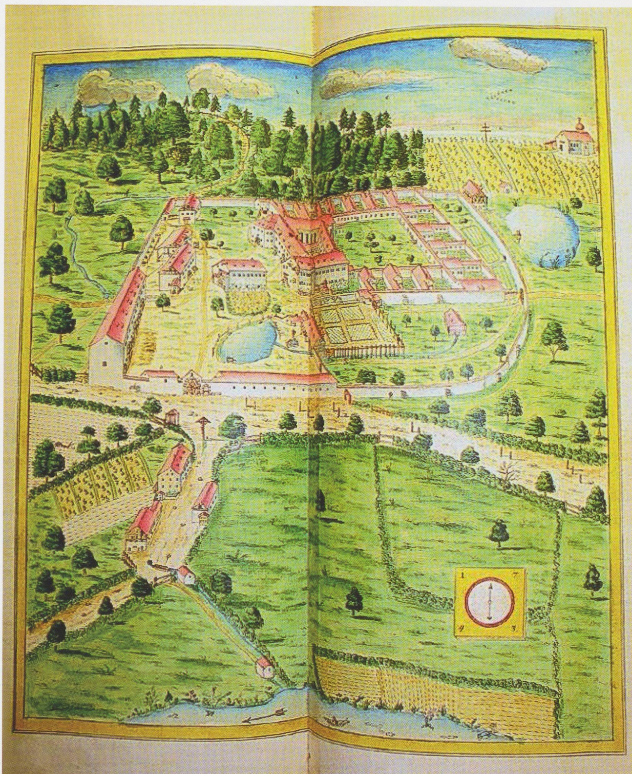
Abb. 4 - Vedute der Kartause von Süden aus dem Urbar von Wech 1743 in Anlehnung an die Tuschezeichnung von 1715 (s. Abb. 2). Amt für Denkmalpflege des Kantons Thurgau.

Der Vergleich mit andern Kartäusen ist nicht einfach, da die Forschung über diese weltlichen, aber existenziellen Fragen erst begonnen hat und die Quellenlage nicht oft so günstig ist wie in Ittingen.