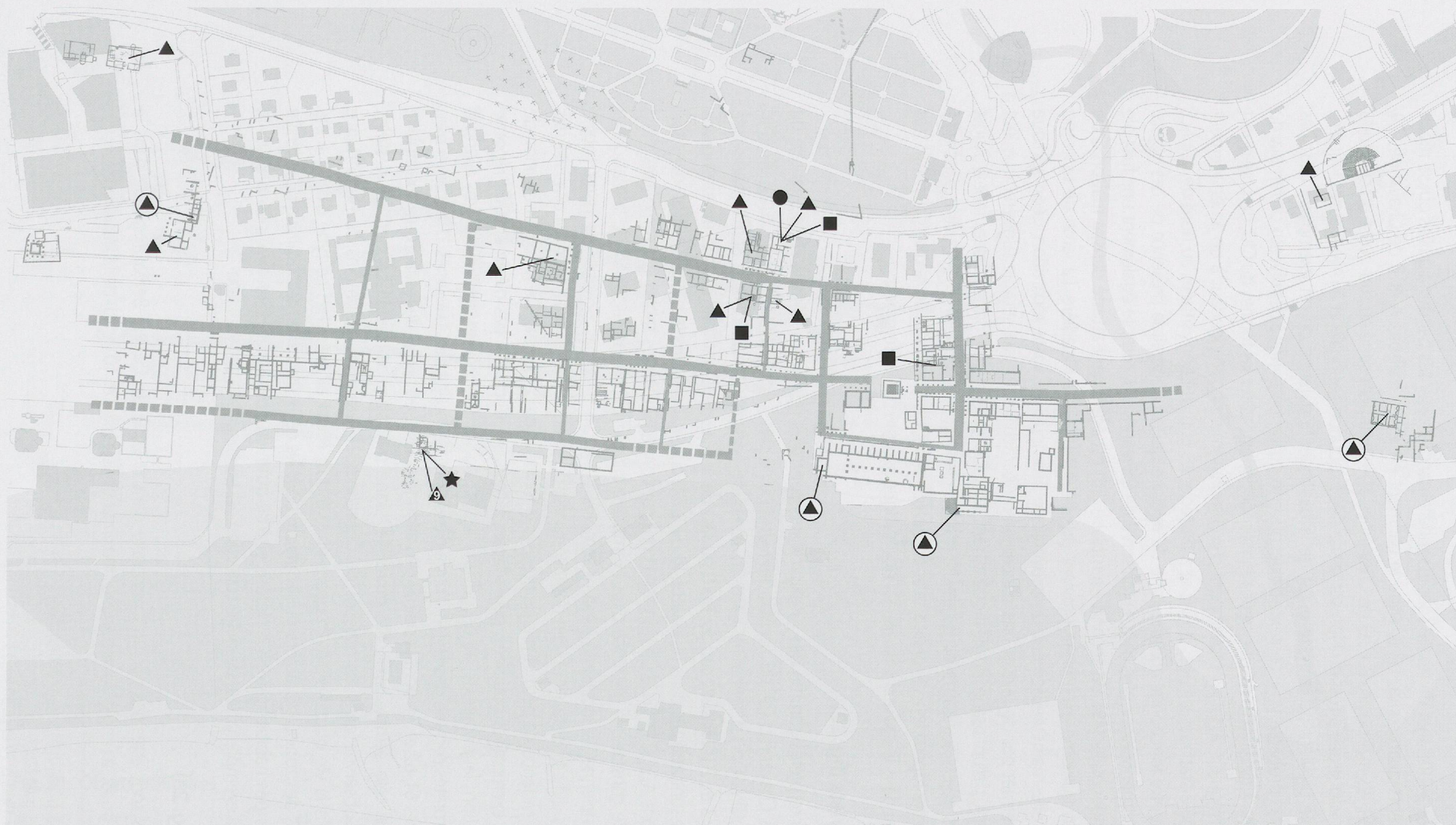
Fig. 21 Artisanat du textile