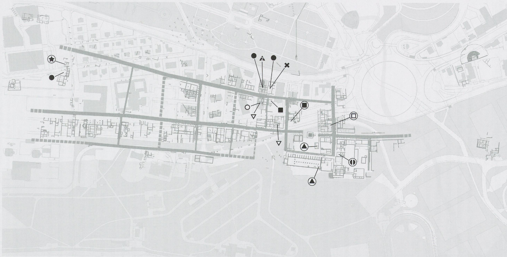
Fig. 20 Objets utilitaires