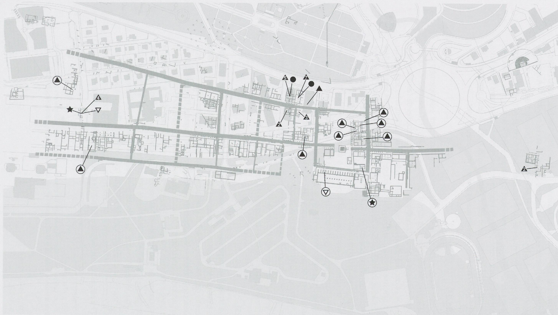
Fig. 24 Ameublement