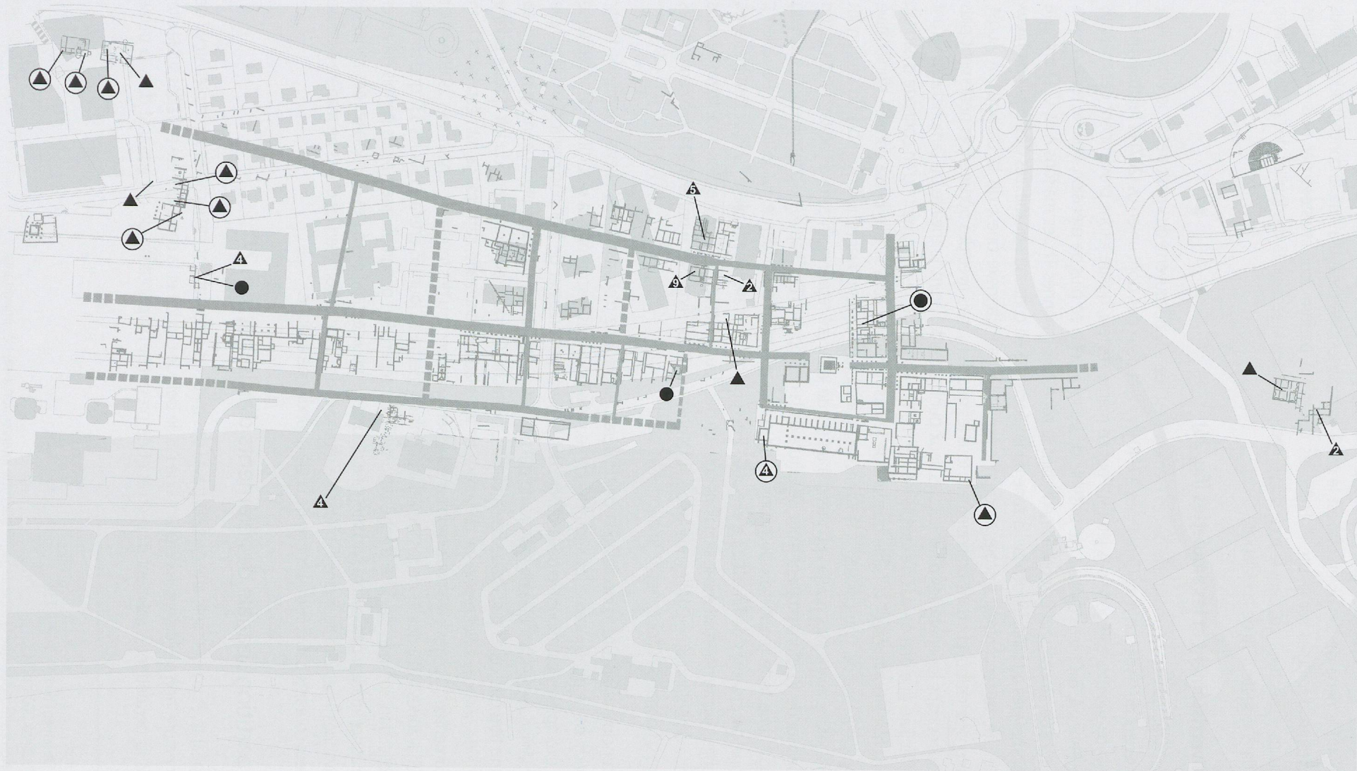
Fig. 25 La parure et la toilette