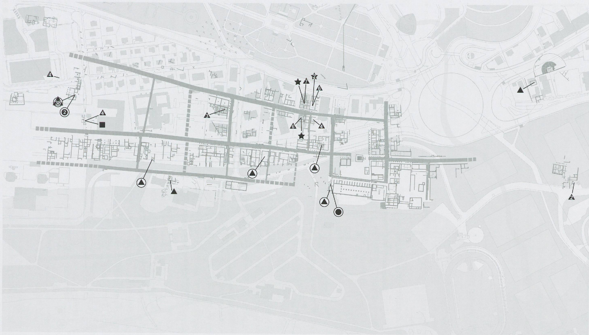
Fig. 26 Divertissement et amulettes