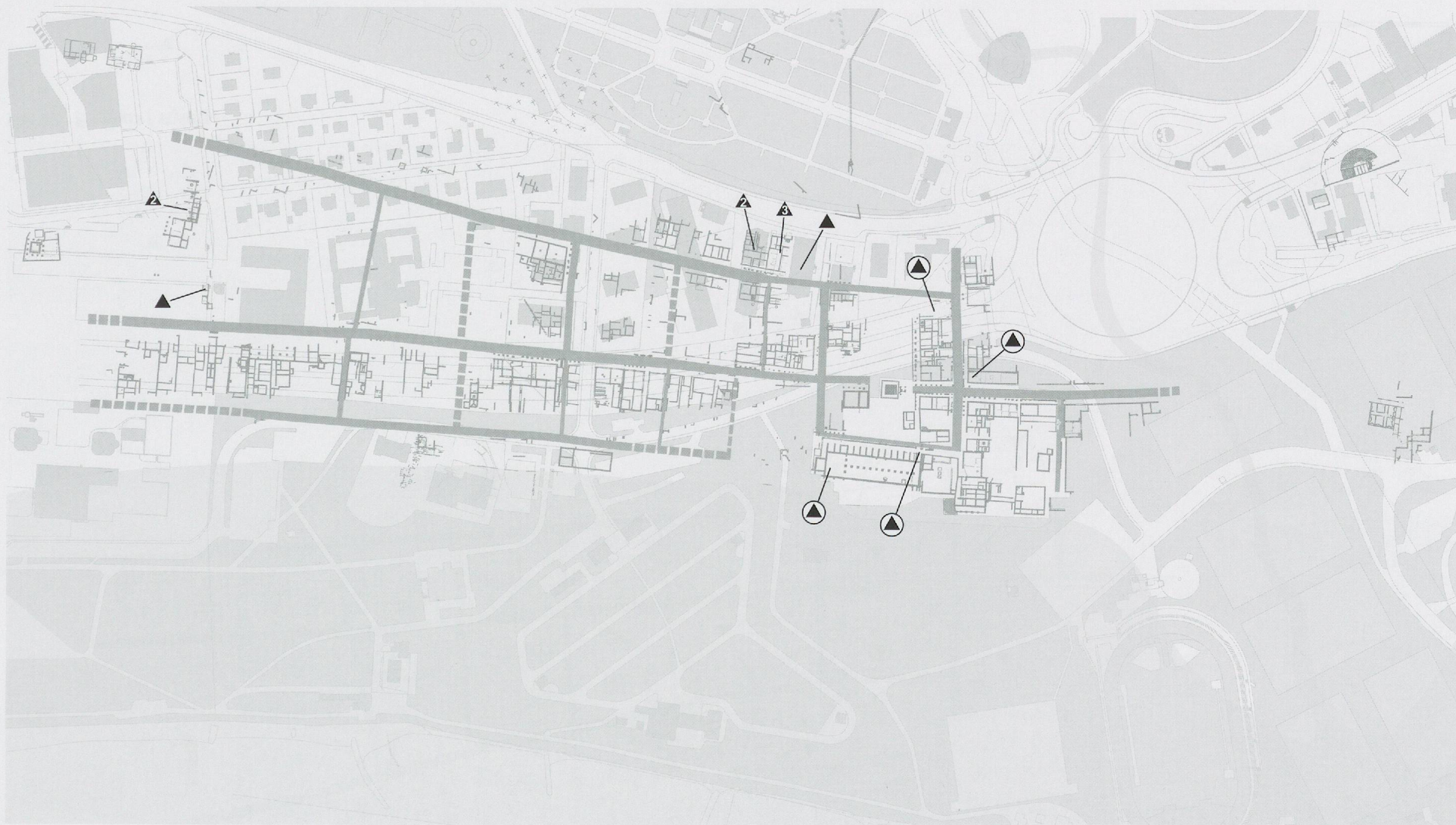
Fig. 23 Cuillères

Symbole sans chiffre : découverte d'un unique exemplaire