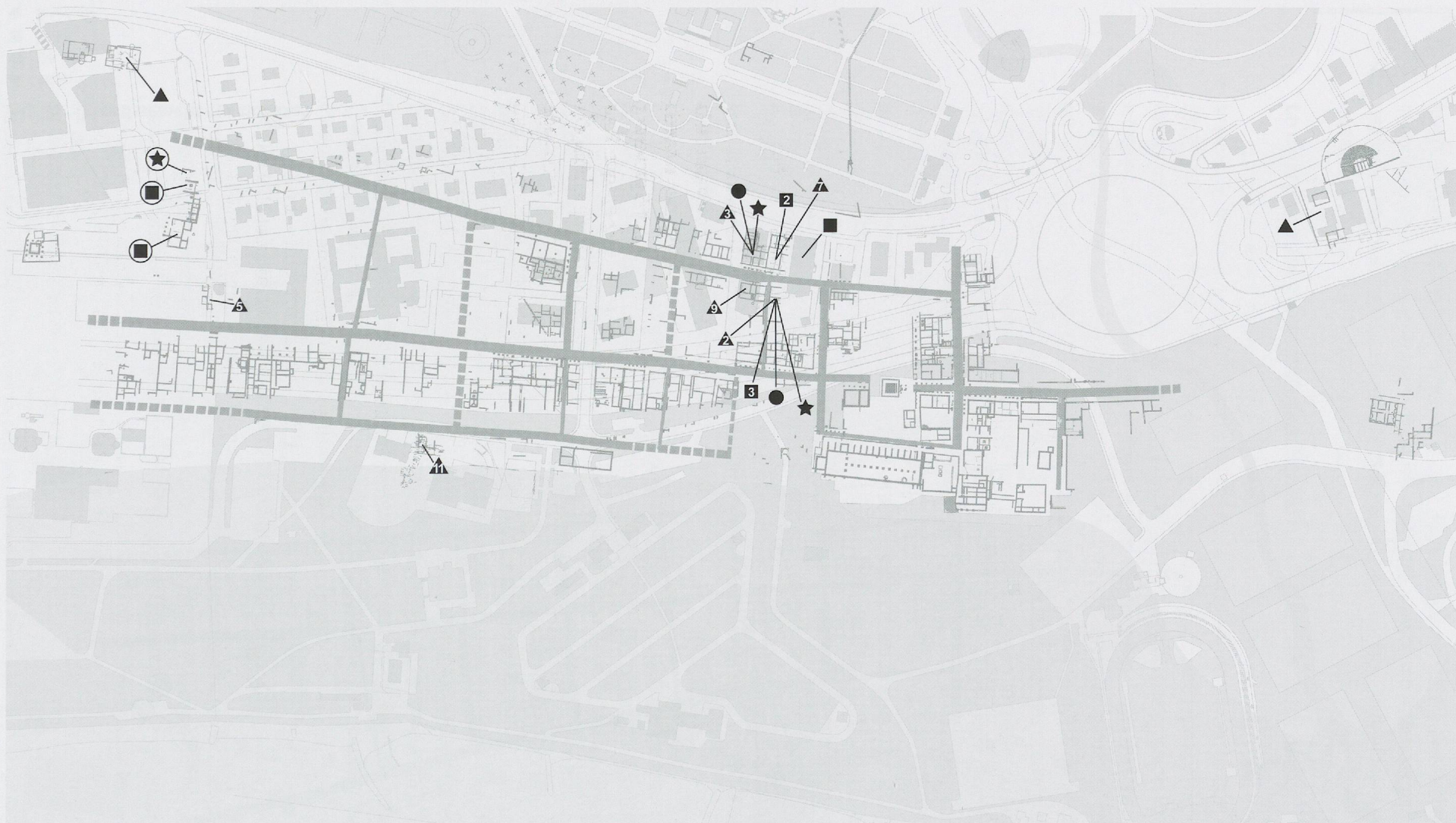
Fig. 27 Artisanat