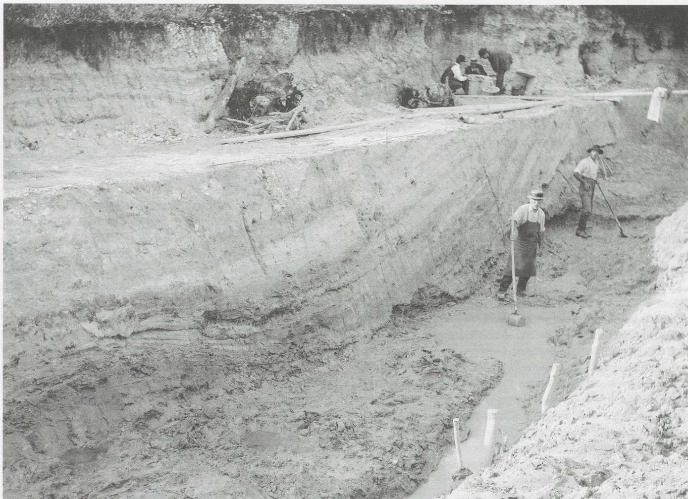
La Tène, 28 septembre 1911 : la fouille systématique de l'ancien lit de la Thielle, par tranchées perpendiculaires au tracé, ouvre des perspectives stratigraphiques spectaculaires sur son remplissage. Albert Naef avait d'ailleurs préconisé de doubler les relevés manuels d'une documentation photographique.