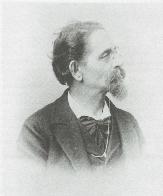
Frédéric Troyon (1815-1866)