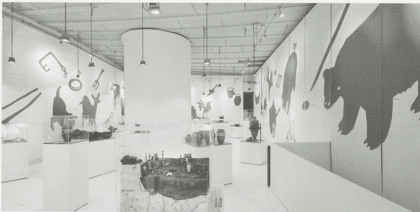
Vue de l'exposition «Les Helvètes au Mormont», du 11 avril au 19 octobre 2014, au château de La Sarraz.

complémentaires : l'archéologie et l'histoire, évidemment, mais également l'ethnographie, l'égyptologie et les sciences de l'Antiquité, entre autres.