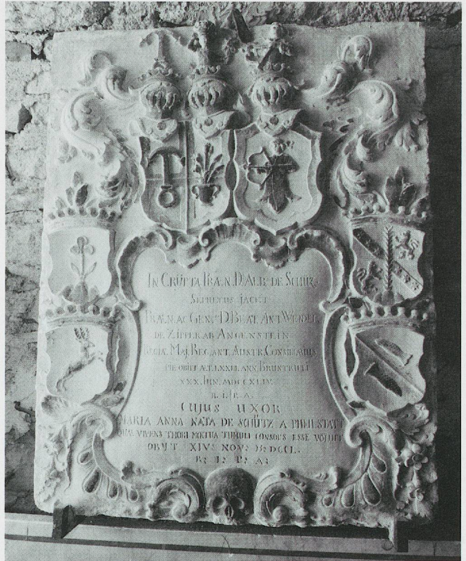
ju-17 – © Maya Birke von Graevenitz

Inscription: IN CRYPTA PRÆN. DOMINI. ALBERTII. DE SCHÜZ. / SEPULTUS JACET / PRÆN. AC GEN SUS D. BEAT. ANT. WENDEL. / DE ZIPPER AB ANGENSTEIN / REGIÆ MAJ. REG. ANT. AUSTR. CONSILIARIUS, / PIE. OBIIT ÆT. LXXIII. ANN. BRUNTRUTI / XXX. IUN. MDCCXLIV. / R. I. P. A. / CUJUS UXOR / MARIA ANNA NATA DE SCHÜTZ A PHEILSTATT / QUÆ VIVENS