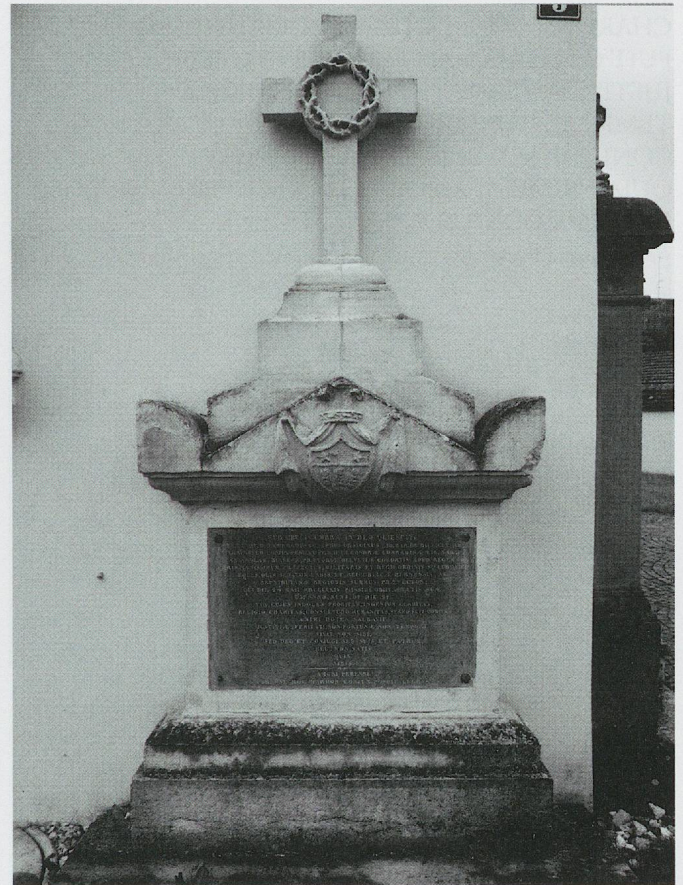
ju-9 – © Maya Birke von Graevenitz

Archives: Office du patrimoine historique, Porrentruy, plan et inventaire des tombes de l'église de Saint-Germain, s.d.