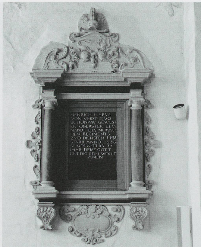
ju-16 – © Karina Queijo

Partiellement conservée, la peinture murale continue la composition architecturale de part et d'autre du monument, mais aussi au-dessus de son fronton. Elle montre à gauche un soldat assis qui appuie sa tête sur sa main. A juger les motifs conservés, ce décor présentait une composition en grande partie symétrique.