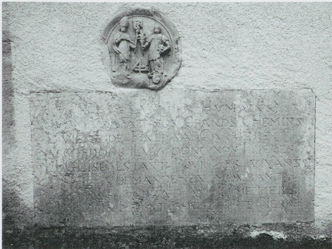
ju-4 – © Maya Birke von Graevenitz

Description: La dalle comprend uniquement l'inscription funéraire. Elle est surplombée par un médaillon orné d'une frise qui représente le défunt aux côtés du prince-évêque, tous deux munis des attributs liés à leurs fonctions. Le prince-évêque vêtu de sa mitre et tenant sa crosse est placé à la dextre du défunt, qui tient un livre et une palme dans sa main droite ainsi que sous le bras gauche des attributs indistincts, probablement liés à sa fonction de directeur des ponts et chaussées. Au bas du médaillon apparaît le chiffre «4».