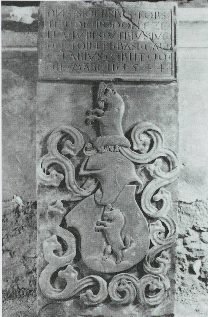
ju-13 – © Office du patrimoine historique, Porrentruy

Matériau et dimensions: Pierre calcaire polychromée; 72 x 112 cm.