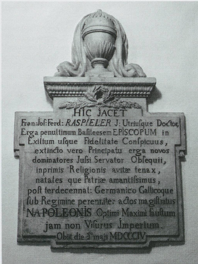
ju-8 – © Maya Birke von Graevenitz

Localisation actuelle: Intérieur, paroi ouest, à gauche de l'entrée. Matériau et dimensions: Pierre calcaire; 100 x 69 cm.