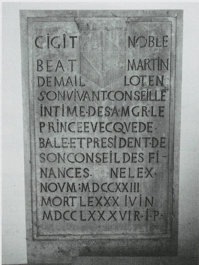
ju-6 – © Maya Birke von Graevenitz

Matériau et dimensions: Pierre calcaire; 124 x 75 cm.