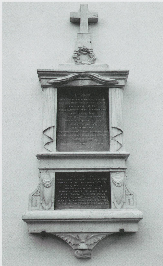
ju-10 – © Maya Birke von Graevenitz

Inscription inférieure: ICI REPOSE / MARIE ANNE LAURENT NÉE DE BILLIEUX, / ÉPOUSE DE FEU M R . LAURENT COL: DU / GÉNIE, NÉE LE 4 AVRIL 1768 / DÉCÉDÉE LE 25 7 BRE 1833. / SERVANTE EIDELLE DE JÉSUS-CHRIST / ELLE L'ADORA DANS SON COEUR / ELLE LE SUIVIT DANS SES CROIX / ELLE LE SOULAGEA DANS SES PAUVRES / SA FOI, SES SOUFFRANCES, SES AUMÔNES / LUI ONT OUVERT LE CIEL.