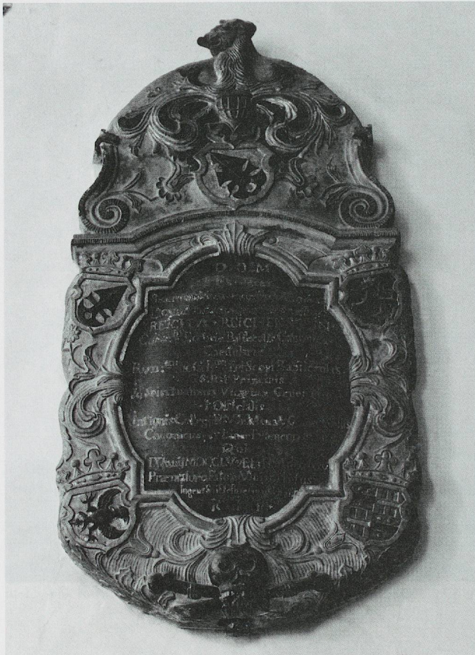
ju-18 – © Karina Queijo

ayant été réalisé postérieurement au plan des sépultures datant de 1753.