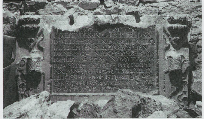
ju-14 – © Maya Birke von Graevenitz

Description: Monument plaqué rectangulaire. La partie centrale portant l'épitaphe incisée est rehaussée d'une peinture noire. Le cadre qui entoure l'inscription est animé par des ornements maniéristes, des motifs du Rollwerk et deux vases sculptés. Tout autour se développe une riche ornementation composée de