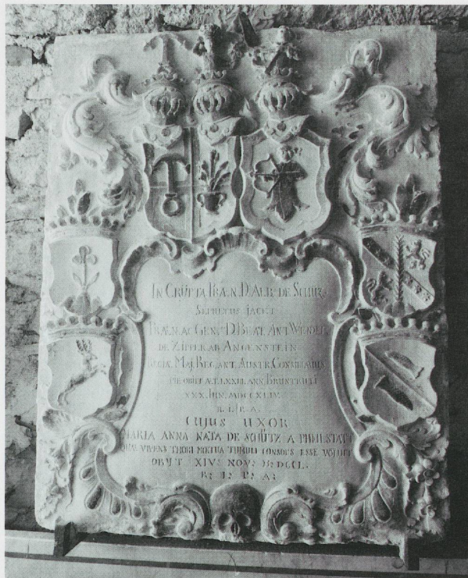
ju-17 – © Maya Birke von Graevenitz

Inscription: IN CRYPTA PRÆN. DOMINI. ALBERTI. DE SCHÜZ. / SEPULTUS JACET / PRÆN. AC GEN SUS D. BEAT. ANT. WENDEL. / DE ZIPPER AB ANGENSTEIN / REGIÆ MAJ. REG. ANT. AUSTR. CONSILIARIUS, / PIE. OBIIT ÆT. LXXIII. ANN. BRUNTRUTI / XXX. IUN. MDCCXLIV. / R. I. P. A. / CUJUS UXOR / MARIA ANNA NATA DE SCHÜTZ A PHEILSTATT / QUÆ VIVENS