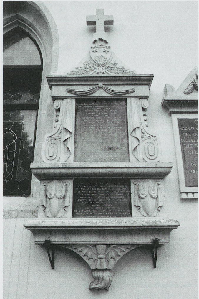
ju-11 – © Maya Birke von Graevenitz

Description: Monument funéraire plaqué, constitué de trois registres séparés par des entablements et des corniches. La base du monument comprend une flamme inversée sous un sablier ailé. Au-dessus, un socle contient l'inscription inférieure, encadrée par des urnes drapées. Le registre principal montre, de part et d'autre de l'épithaphe, un drapé accroché à l'entablement et des volutes stylisées. L'amortissement supérieur pyramidal présente les armoiries familiales surmontant deux branches de laurier