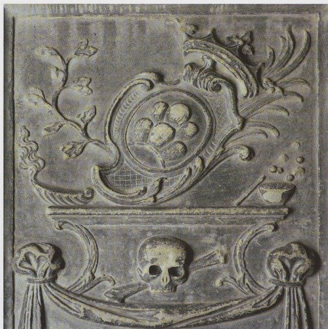
Fig. 91. Payerne, église réformée paroissiale, monument de Johanna Salomé Effinger († 1739), détail.