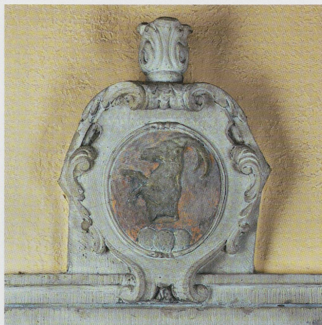
Fig. 88. Bière, église réformée, monument de David Steiger (†1733), détail.

Si la représentation des armes demeure fidèle aux règles héraldiques à travers les siècles, la place allouée aux