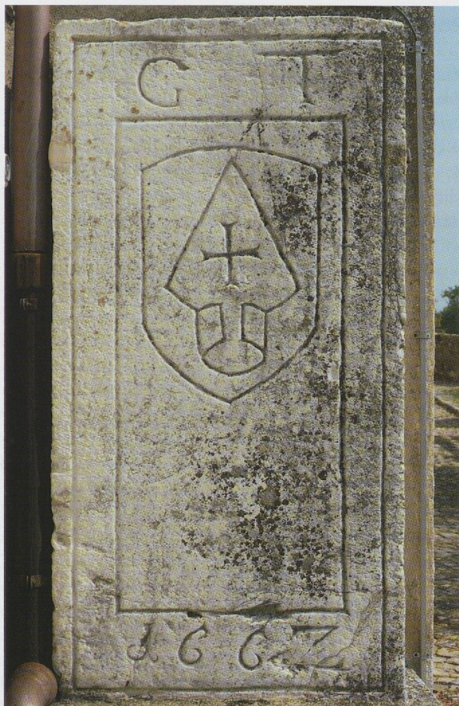
Fig. 87. Concise, église réformée, monument de Georges Tribolet (†1662).

et de David Steiger (†1733) à l'église de Bière (fig. 88). La représentation des blasons est cependant fidèle à la description donnée par les armoriaux. Les graveurs et les sculpteurs, de même que les commanditaires semblent posséder une bonne maîtrise de l'héraldique, particulièrement dès le début du XVIII e siècle, où les hachures dites « conventionnelles », exprimant les émaux, apparaissent sur les écus funéraires 13 . Un renouvellement de la mise en scène et en valeur des armoiries s'observe également à la même période. Cette maîtrise et cette connaissance de l'héraldique sont à relier avec l'engouement de la société pour l'histoire et la généalogie qui débute dès la fin du XVI e siècle et s'exprime notamment dans l'usage de reliures et d'ex-libris armoriés 14 qui ont pu servir de modèles aux sculpteurs.