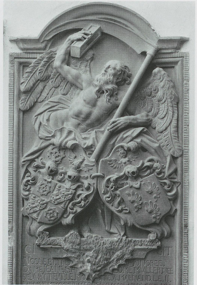
Fig. 90. Granges-près-Marnand, monument de Jeanne-Salomé de Watteville († 1726), détail (Photo Claude Bornand).

La couronne à fleurons, feuilles, croix ou perles – motifs hérités de la hiérarchie nobiliaire – remplace progressivement l'usage du heaume et du cimier dès la fin du XVII e siècle. Son succès au siècle suivant s'explique sans doute par le signe de distinction qu'elle évoque. Les quelques heaumes subsistant au XVIII e siècle prennent alors un caractère archaïsant suggérant l'ancienneté des armes. Avec l'apparition de la couronne, l'entourage de l'écu se transforme. Aux virevoltants lambrequins (lambreaux de tissu évoquant les tournois médiévaux) sortant du heaume sont préférés palmes, feuilles d'acanthé, rameaux et lauriers. Deux palmes nouées ouvrent la perspective d'un décor végétal plus simple et plus réaliste dès la fin du XVII e siècle. Or, dès 1719 33 , les feuilles d'acanthé, dont les contours rappellent certainement les lambrequins, supplantent les deux palmes jusqu'à la venue