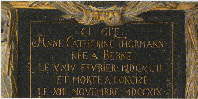
Fig. 58. Concise, église réformée, épitaphe pour Anne-Catherine Thormann († 1719) (Photo Laurent Dubois).