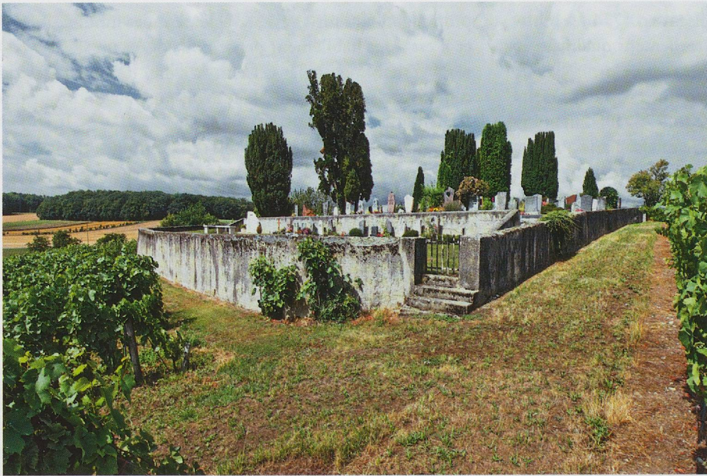
Fig. 27. Aclens, cimetière caractéristique avec ses murets et sa végétation sempervirens.

les sépultures dans les lieux de culte et va même jusqu'à ordonner l'éloignement des cimetières qui devront désormais se situer au-delà des enceintes des agglomérations françaises 17 . Sur ce point, le Canton de Vaud tarde à se mettre à jour puisqu'il faut attendre le 16 janvier 1812 pour voir la première véritable loi cantonale portant sur la police des enterrements. Cet arrêté du Petit Conseil constitue un véritable tournant dans la topographie funéraire vaudoise; il contribue à redéfinir aussi bien la localisation, la structure que l'usage des cimetières. Dès lors, «aucun cimetière ne peut être établi dans l'enceinte d'une Ville ou d'un village» 18 ; de plus, tout cimetière devra être tenu clos et ne servira à aucun «autre usage qu'à enterrer les morts» 19 . Si les exemples étudiés montrent que ces dispositions tarderont à être appliquées systématiquement, sans doute parce qu'ils relèvent de la responsabilité des communes, la dynamique de transformation du paysage cémétériel vaudois est cependant lancée. En outre, de décennie en décennie, des articles de loi de plus en plus détaillés sont votés en vue de compléter ou de corriger certains aspects de la police des enterrements, notamment pour ce qui relève de l'hygiène. A titre d'exemple, la loi sur les inhumations du 25 mars 1834 précise que le sol choisi en vue d'installer un cimetière ne doit pas être humide afin de pouvoir y creuser «des fosses de six pieds de profondeur» 20 . Le même arrêté