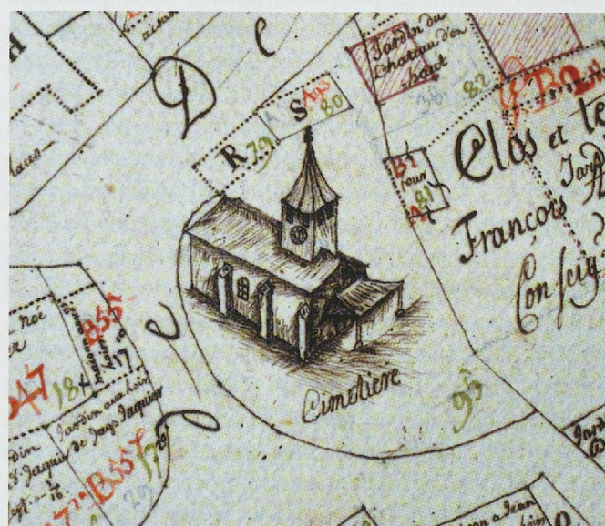
Fig. 25. Démoret, le temple et son cimetière selon le plan cadastral de 1730 (ACV).

Trois caractéristiques distinguent fondamentalement les cimetières de l'Ancien Régime de ceux des siècles suivants : la localisation, la structure et l'usage. Ces critères sont