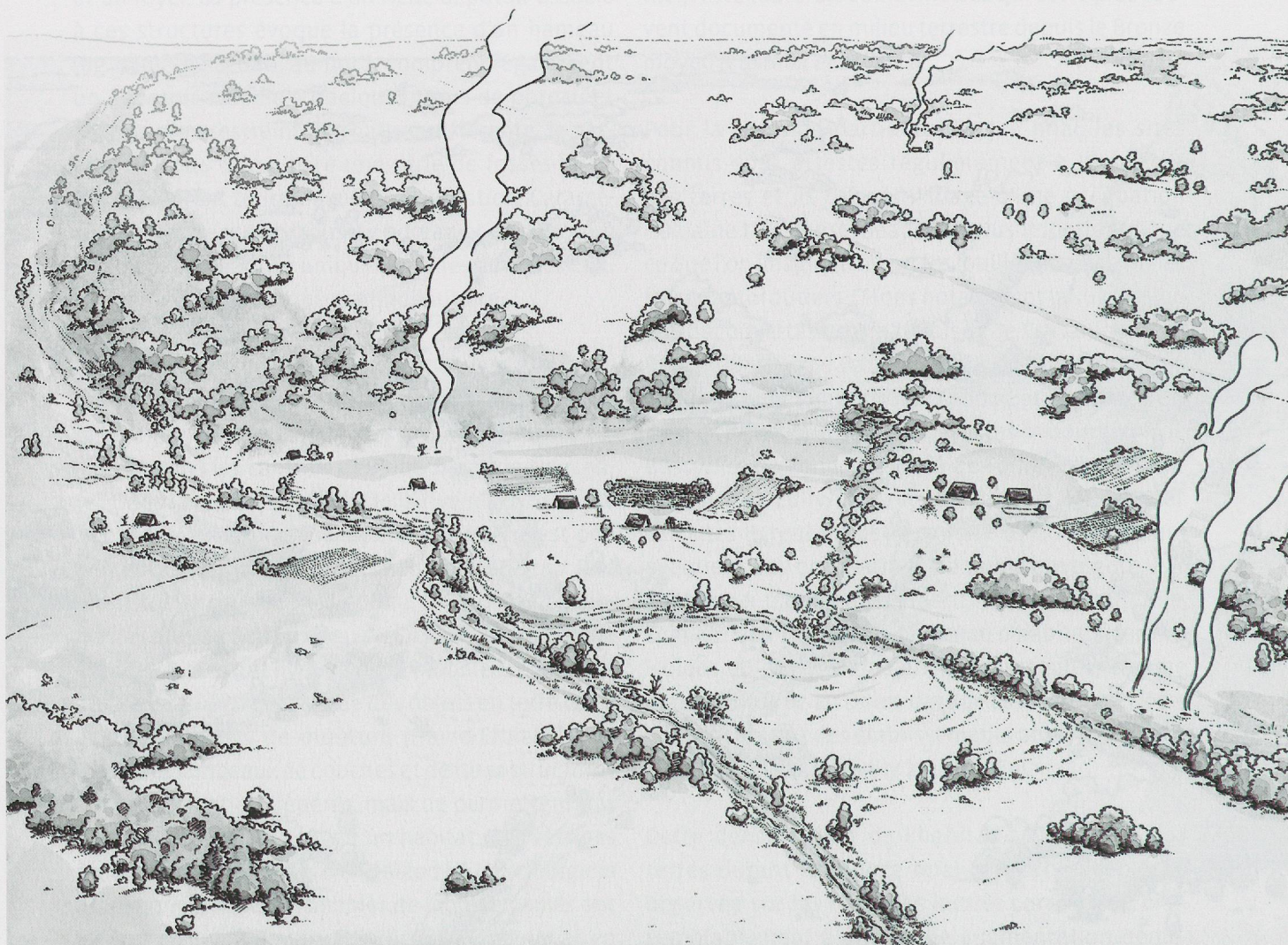
Fig. 266. Proposition de reconstitution de l'environnement et de l'occupation des versants sud et ouest de la colline d'Onnens au HaB.