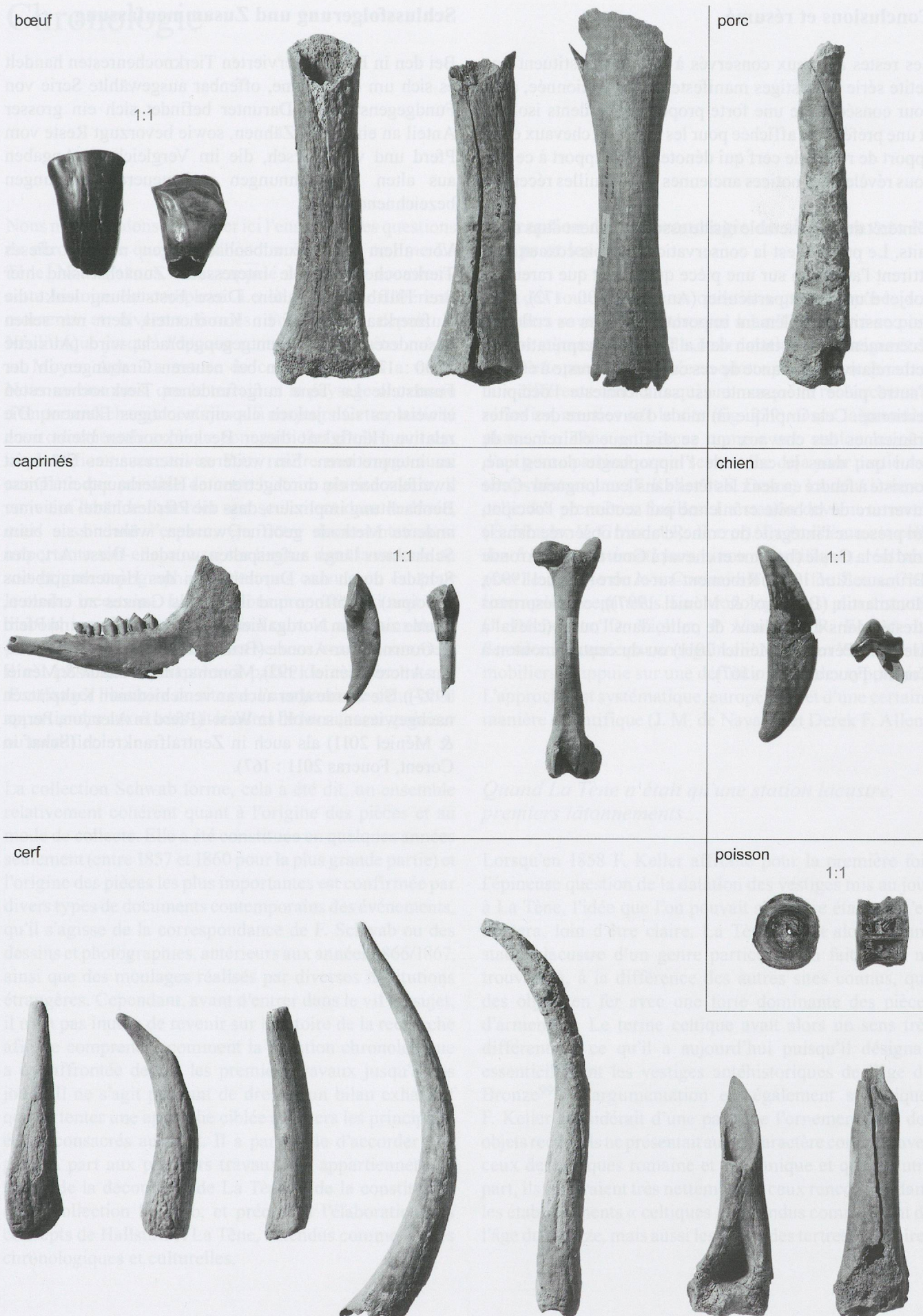
Fig. 238 : Les restes de boeufs, porc, caprinés, chiens, cerfs et poissons. Échelle 1:3.