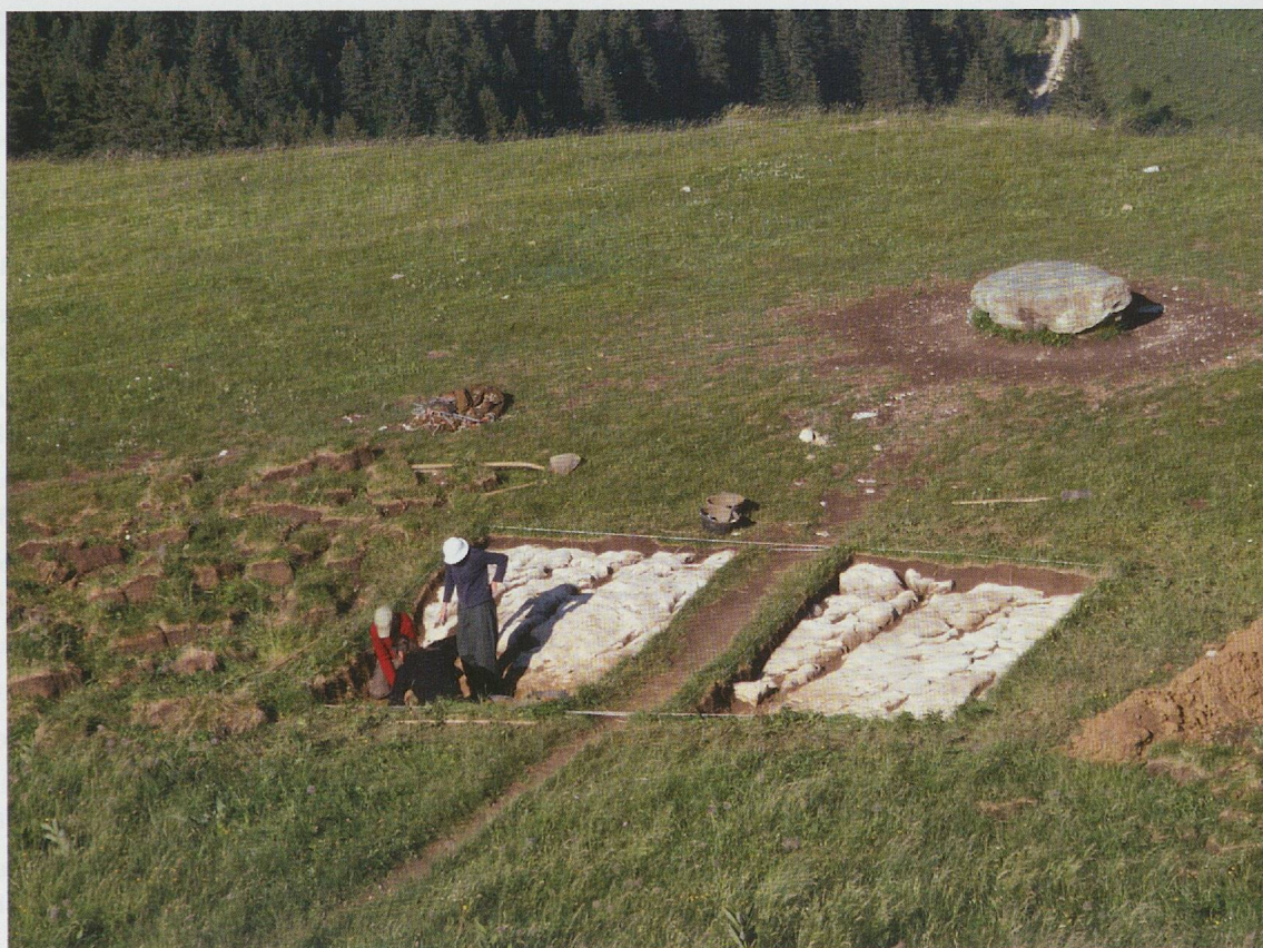
Pl. 7.2 Fouille à la « Pierre de la Paix » en 2005.