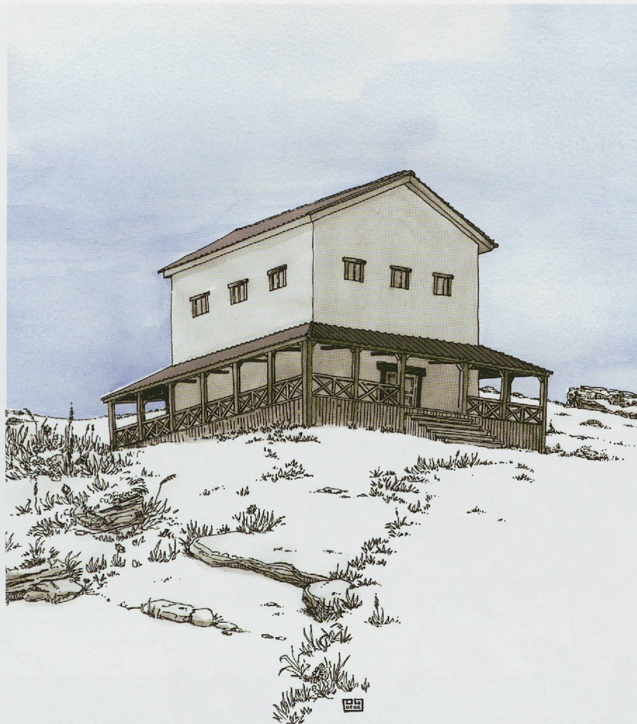
Pl. 1.1 Evocation du temple du Chasseron réalisée en 2006. Dessin de D. Glauser (IASA).