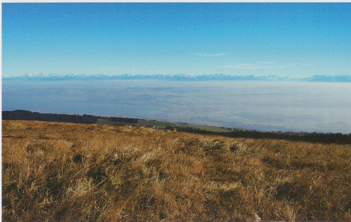
Pl. 3.2 Panorama depuis la terrasse du temple.