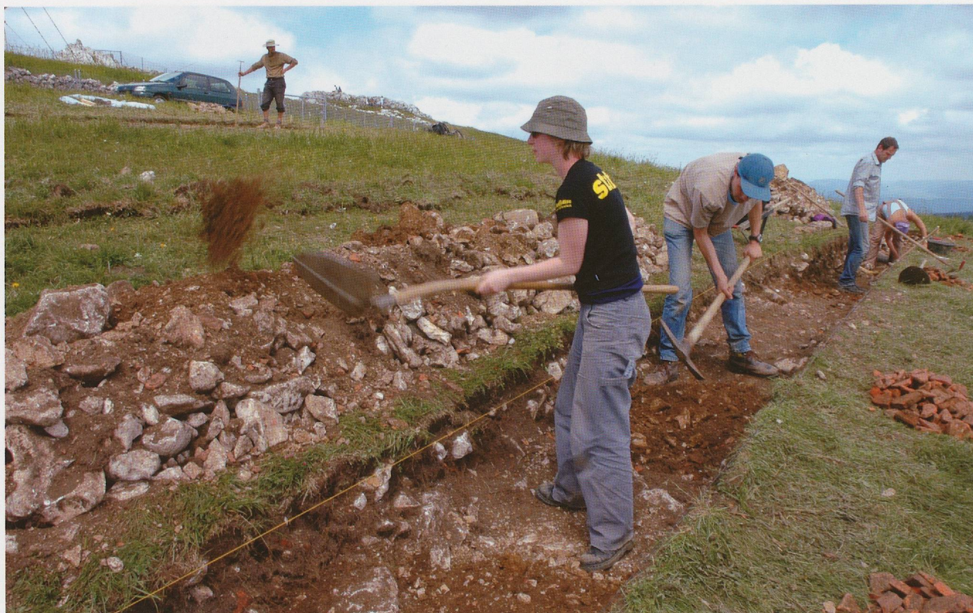
Pl. 4.1 Fouille de diagnostic sur la terrasse du temple en 2004.