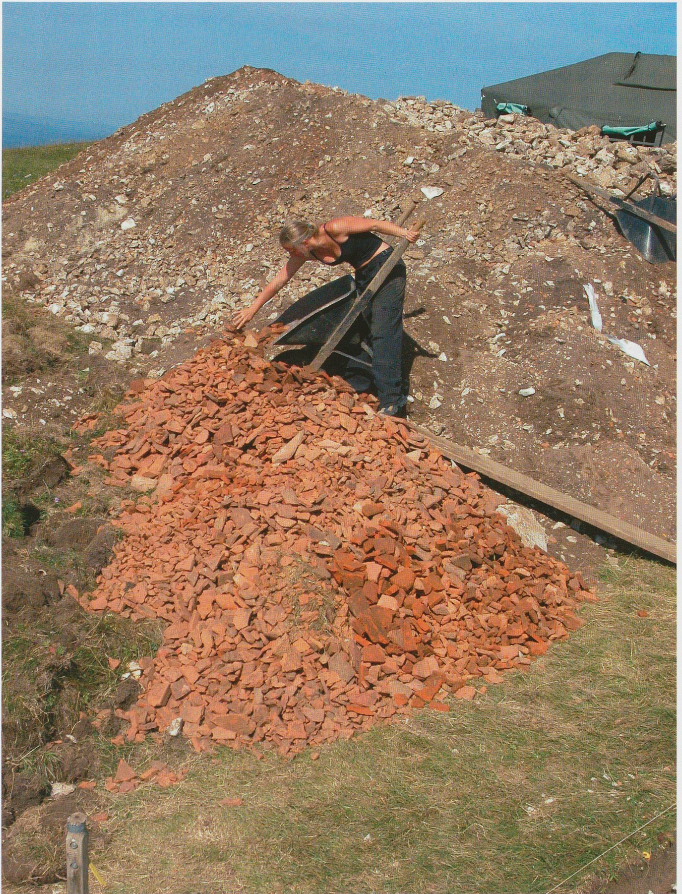
Pl. 5 Pesée des tuiles du temple lors de la campagne de fouilles 2005.