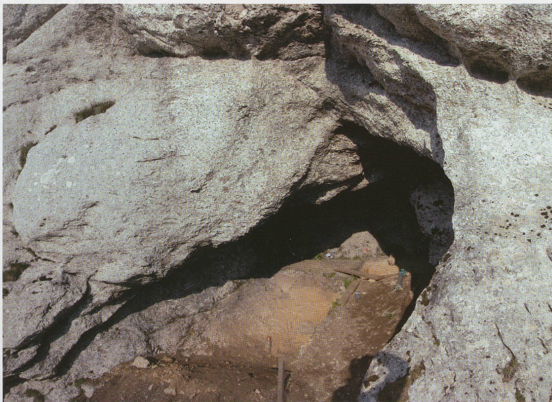
Pl. 7.1 Fouille à la « Grotte du Petit Bossu » en 2005.