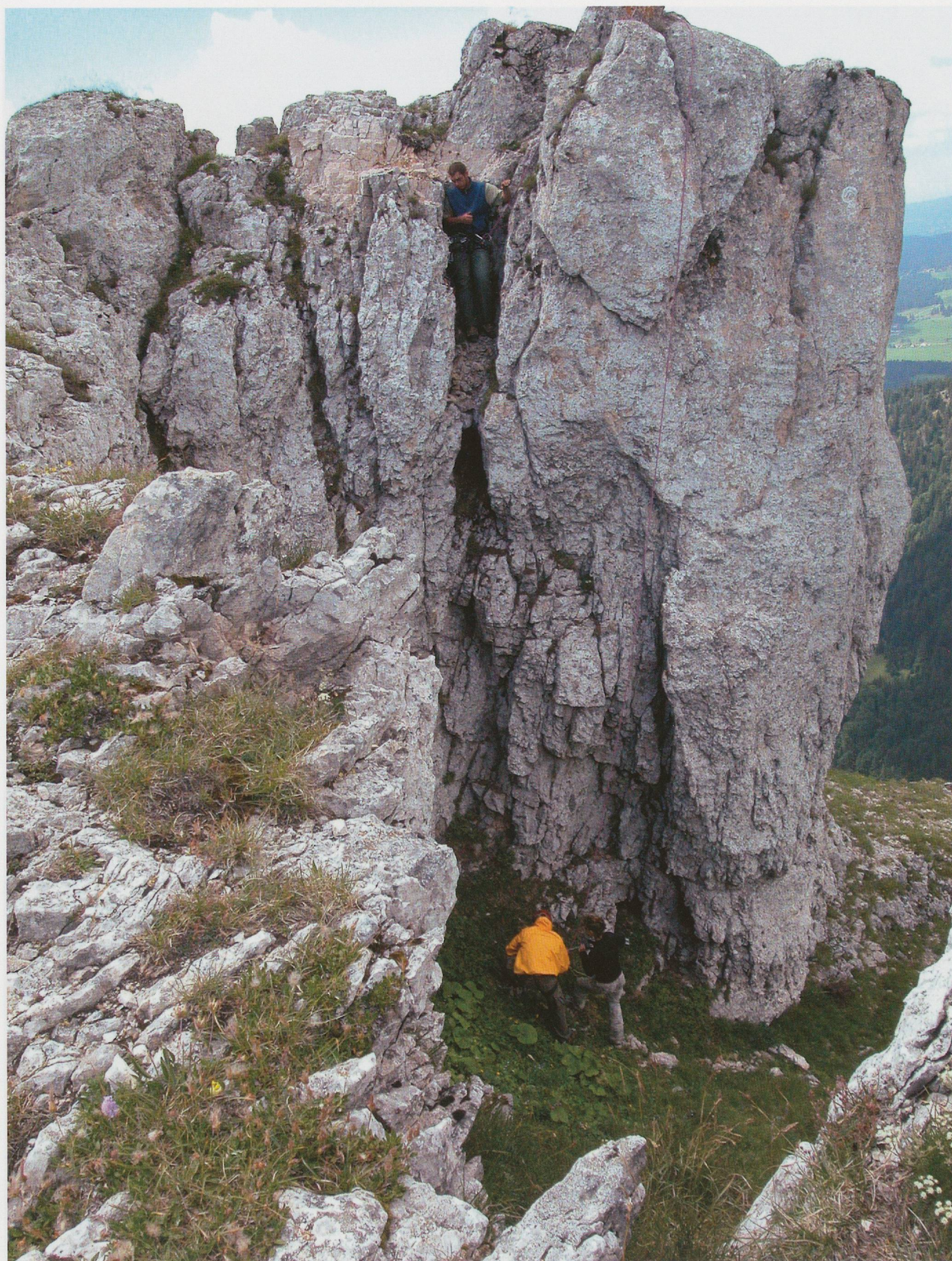
Pl. 6 Prospection au détecteur à métaux dans les falaises (éperon de la iactatio) en 2005.