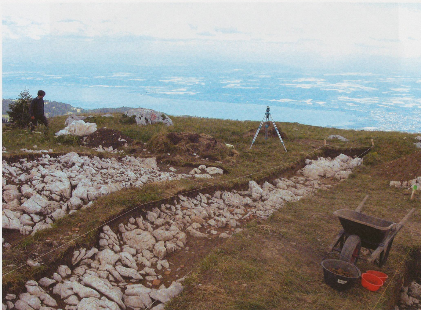
Pl. 8.1 Fouille au « Plan des Centurions » en 2005.