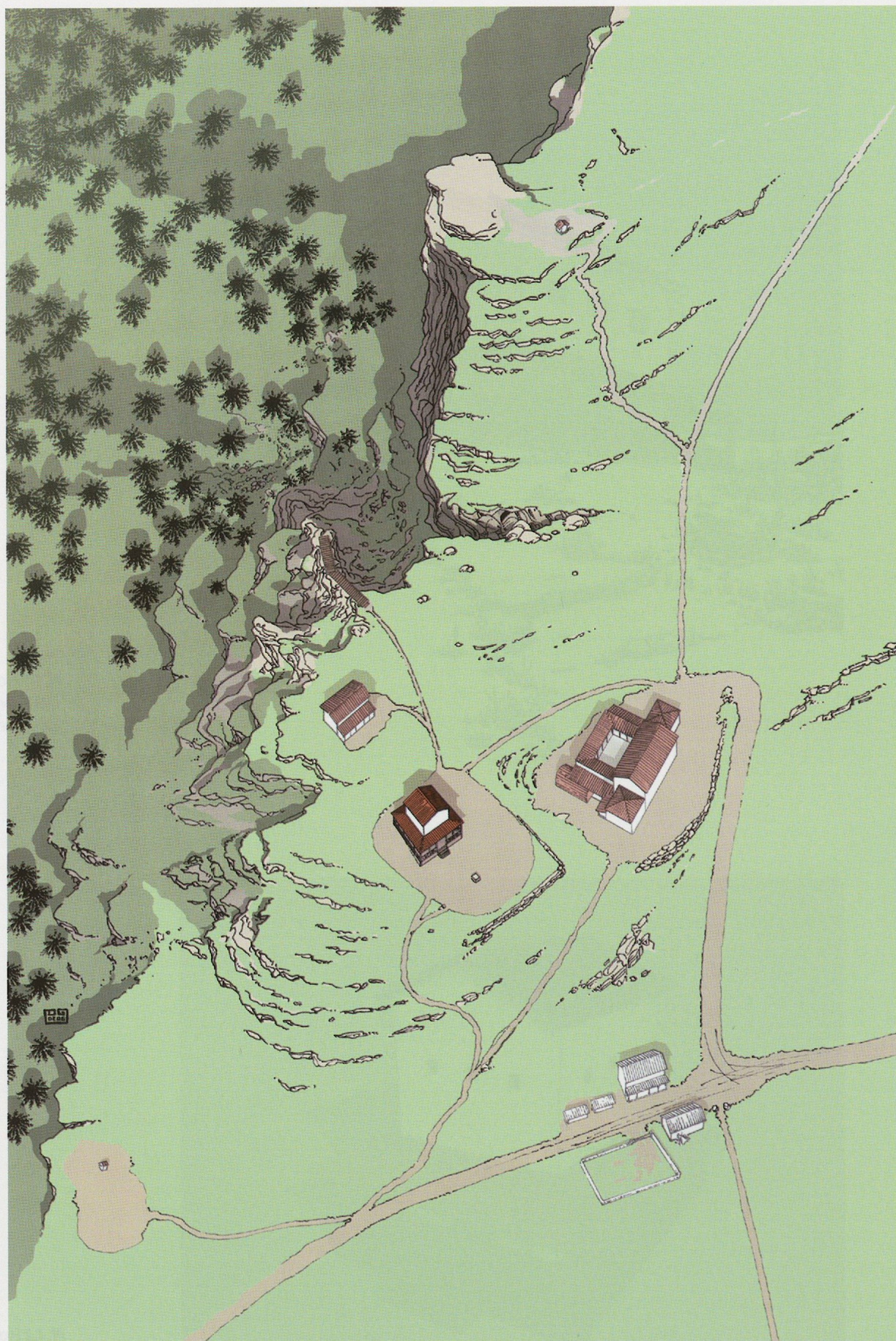
Pl. 2 Evocation du sanctuaire du Chasseron à la fin du 1 er siècle de notre ère. Dessin de D. Glauser (IASA).