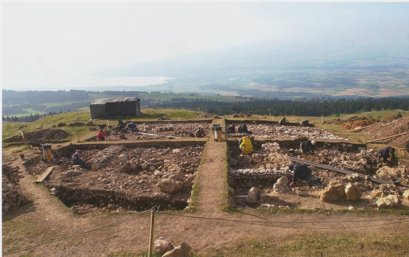
Pl. 3.1 Vue générale de la terrasse du temple en cours de fouilles (2005).