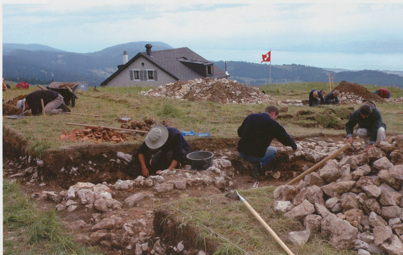
Pl. 4.2 Fouille de diagnostic sur la terrasse du temple en 2004.