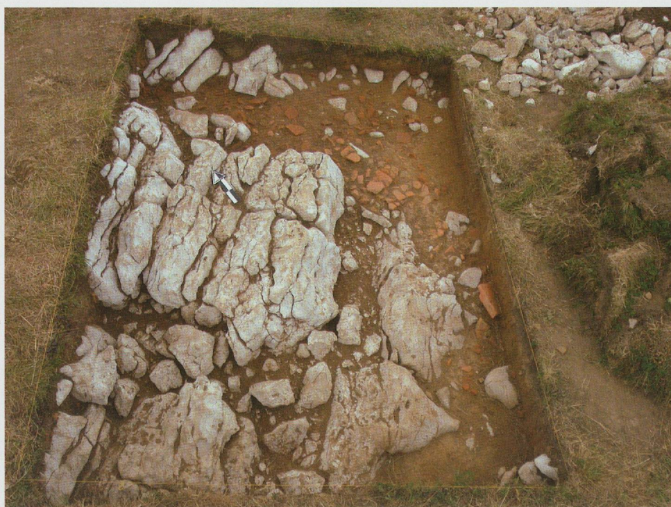
Pl. 8.2 Substrat rocheux et fragments de tuiles romaines au « Plan des Centurions » (secteur C, 2005).