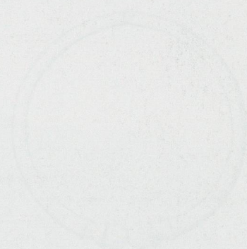
Fig. 1.1. Stempel des Kantons Vaud aus dem Jahr 1848

Un grand merci également à nos jeunes aides locaux: Axel Paillard, Sarah Simon et Estelle Montandon. (TL)