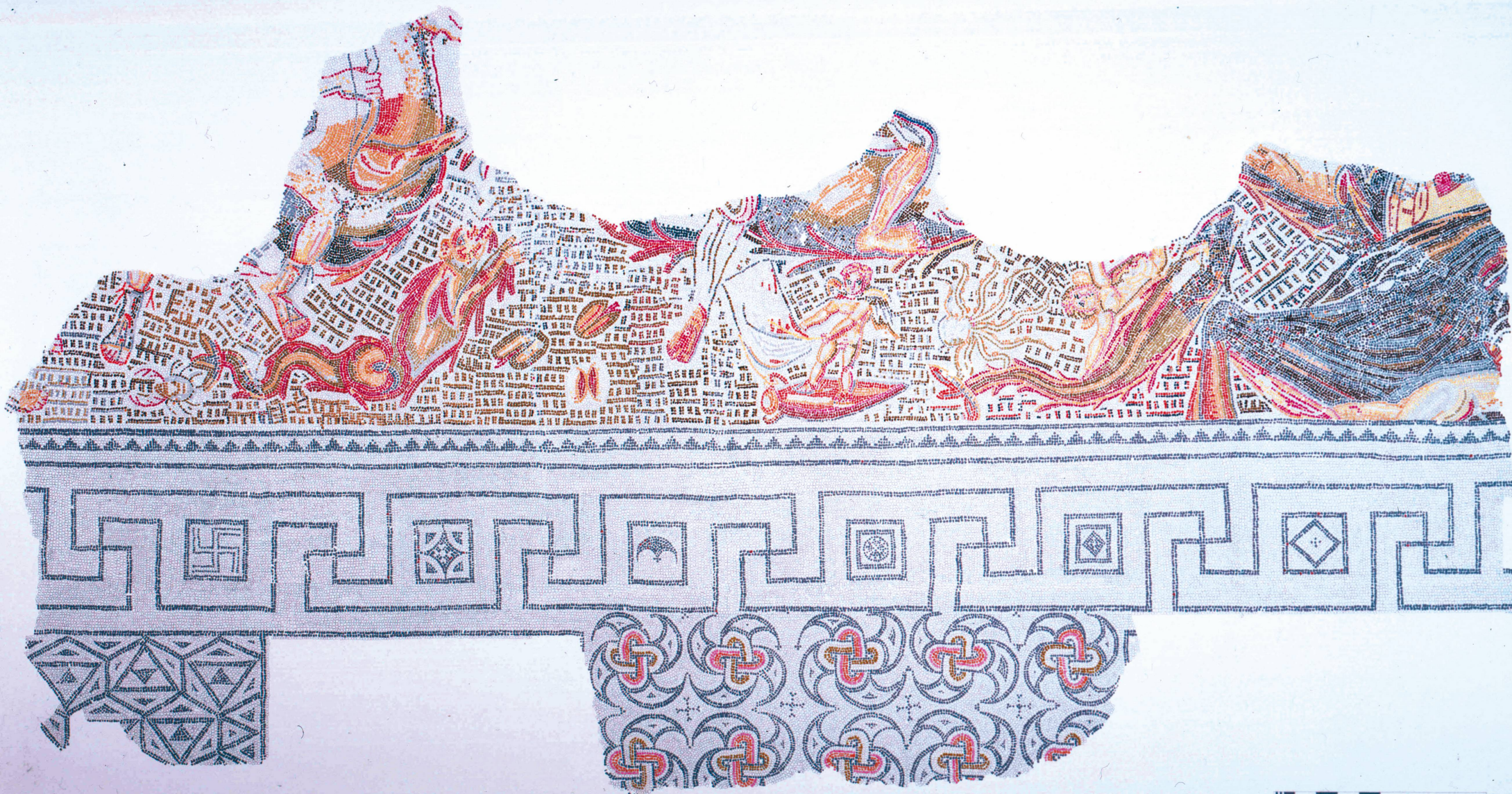
Tesselle à tesselle de la mosaïque de Neptune. Dessin: S. Rebetez.