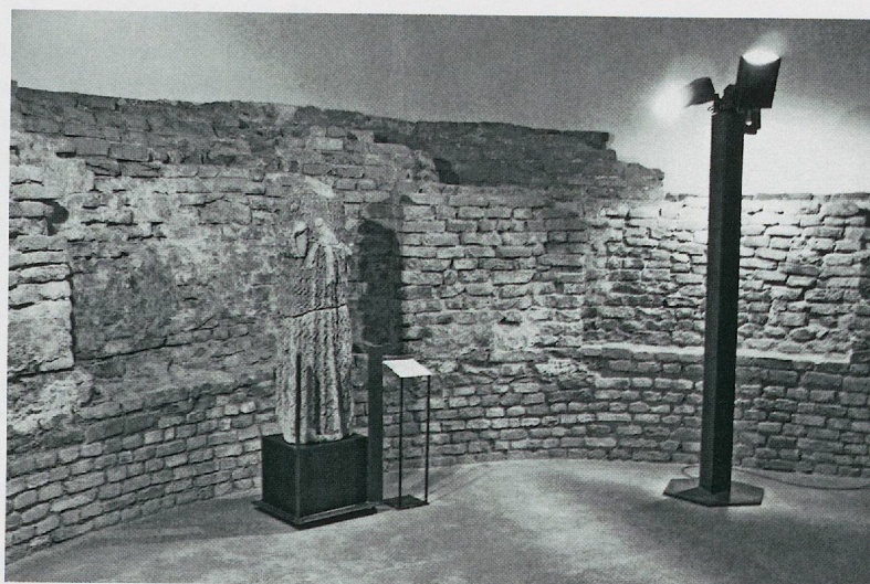
Fig. 4 — Asti, Museo diocesano. Abside della cripta di S. Giovanni Battista e statua dello stesso santo (xiv secolo).

In questo dialogo tra i materiali e le strutture (fig. 4), il Tesoro della Cattedrale e della diocesi costituirà il più alto esempio nel quale la preziosità e la bellezza si fondono con la cultura e la storia della Chiesa astigiana.