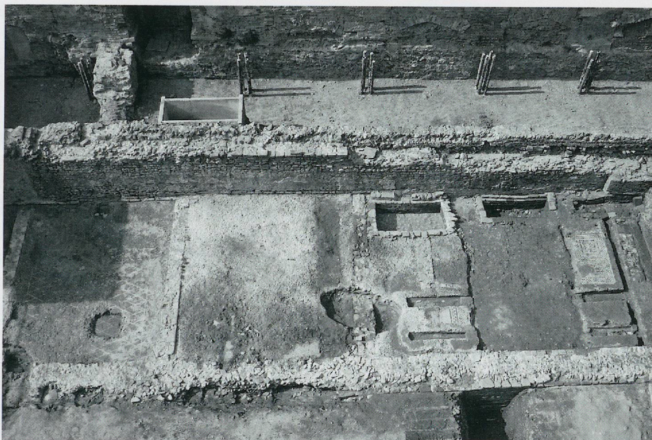
Fig. 1 — Asti, Museo diocesano. Un settore della domus di età romana.

La presenza di un vescovo titolare della diocesi alla metà del v secolo e la sicura esistenza delle prime chiese cattedrali nelle diocesi vicine possono considerarsi elementi significativi per una collocazione cronologica del gruppo episcopale astigiano. Nel corso del v secolo, verosimilmente nella seconda metà, si completò la costruzione degli edifici di culto, nella zona ancora oggi sede del complesso della cattedrale.