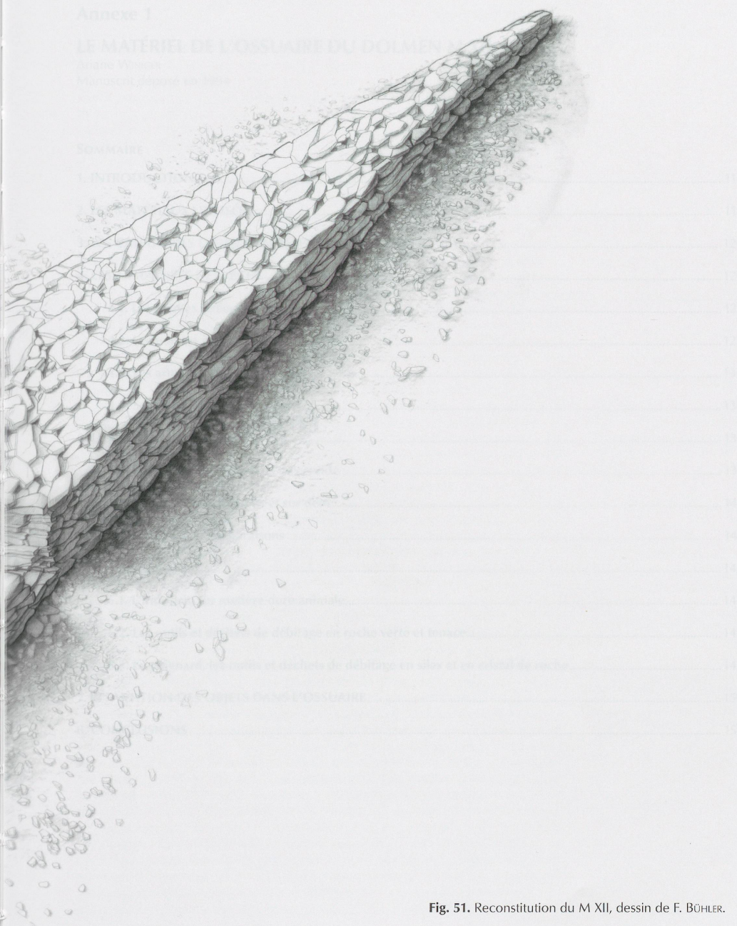
Fig. 51. Reconstitution du M XII, dessin de F. BÜHLER.