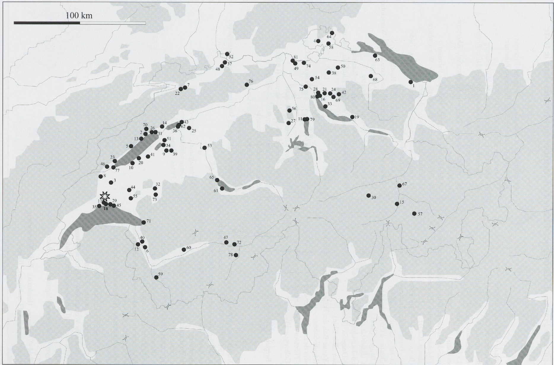
Fig. 110: Localisation des sites suisses mentionnés dans le texte.