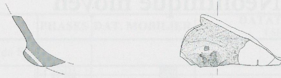
Fig. 13. Structure ST2, Néolithique moyen. Mobilier (céramique) (éch. 1:4).

Cette dernière se développe en Suisse occidentale durant la première partie du IV e millénaire av. J.-C. Les autres éléments découverts ne présentent aucun critère typologique. Un tesson atypique se situait à la base de la fosse avec quelques charbons