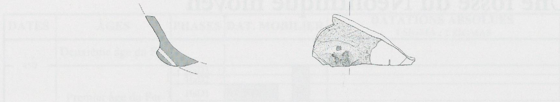
Fig. 13. Structure ST2, Néolithique moyen. Mobilier (céramique) (éch. 1:4).

Cette dernière se développe en Suisse occidentale durant la première partie du IV e millénaire av. J.-C. Les autres éléments découverts ne présentent aucun critère typologique. Un tessons atypique se situait à la base de la fosse avec quelques charbons