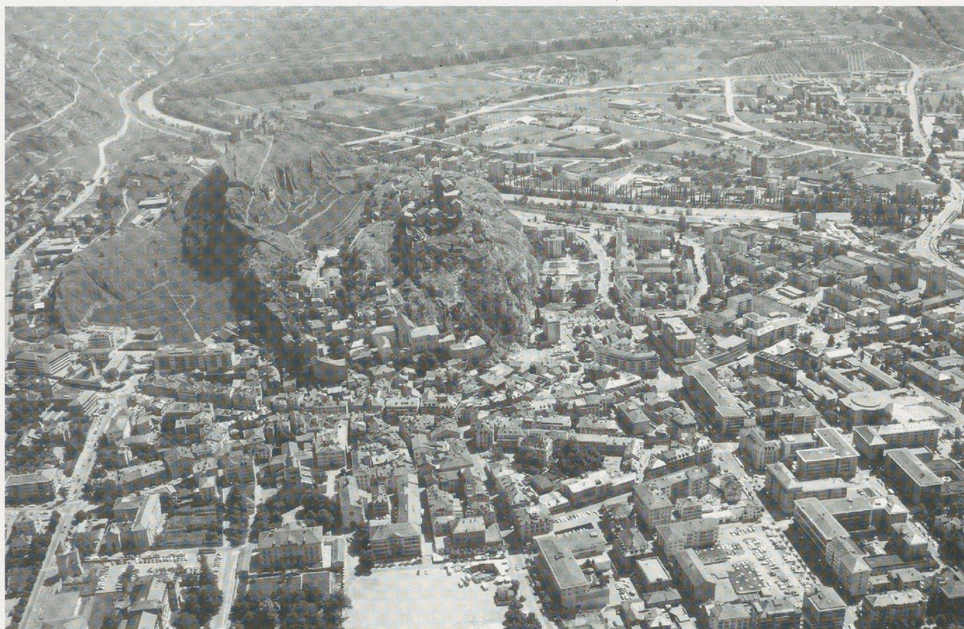
Abb. 90 Stadtaufsicht (Flugaufnahme)