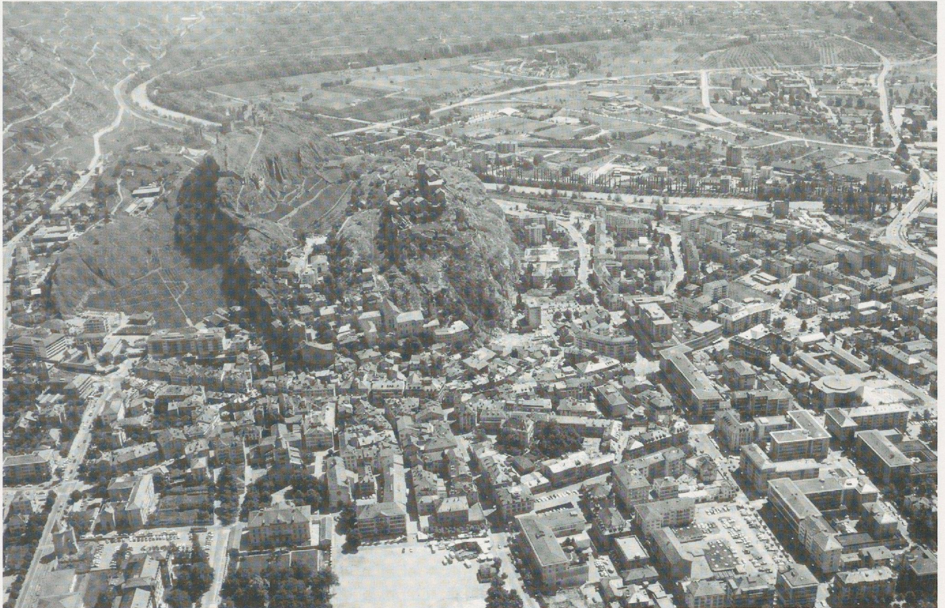
Abb. 90 Stadtaufsicht (Flugaufnahme)