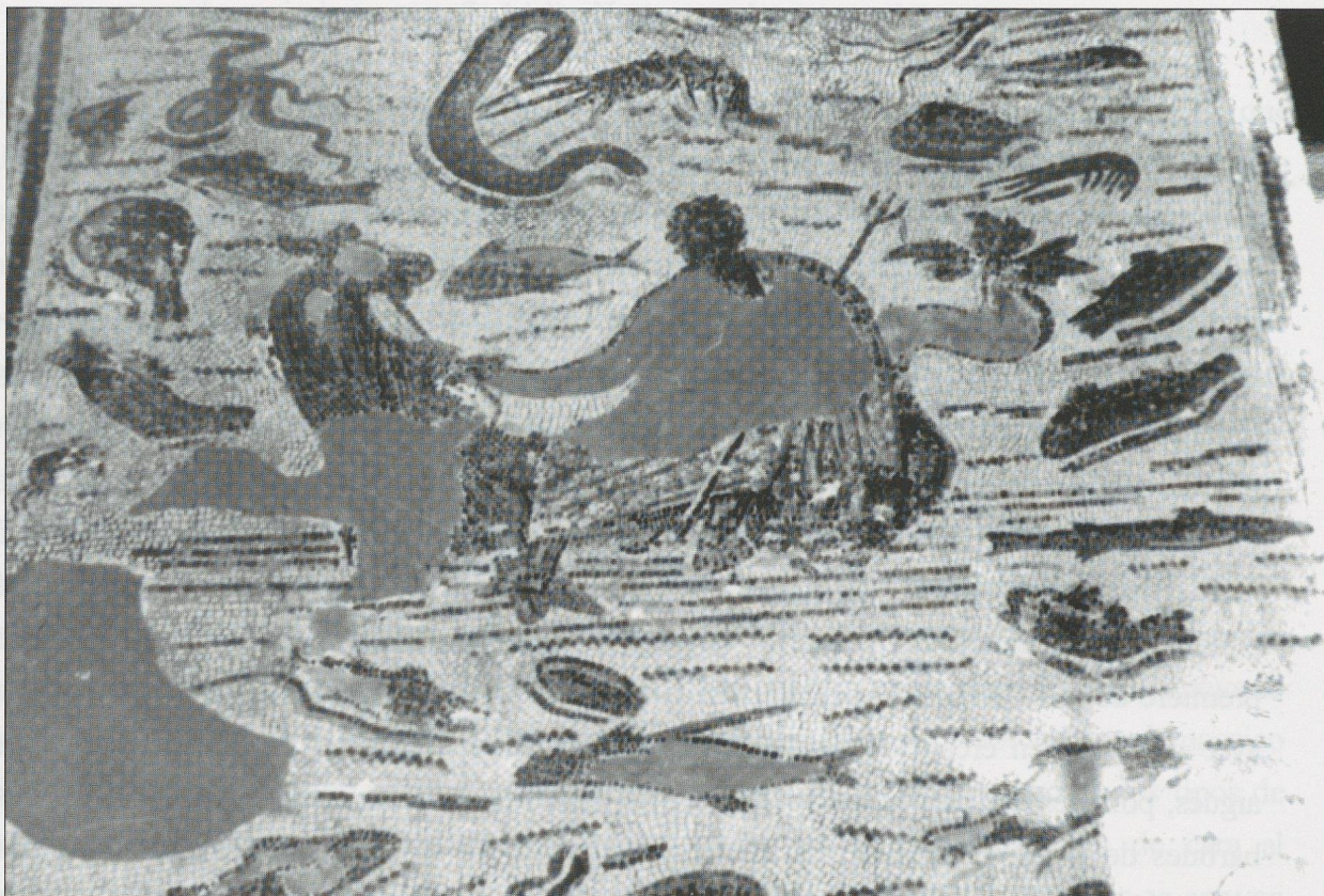
Lám. I - Mosaico de la Casa de los Capiteles Compuestos de Uthina .