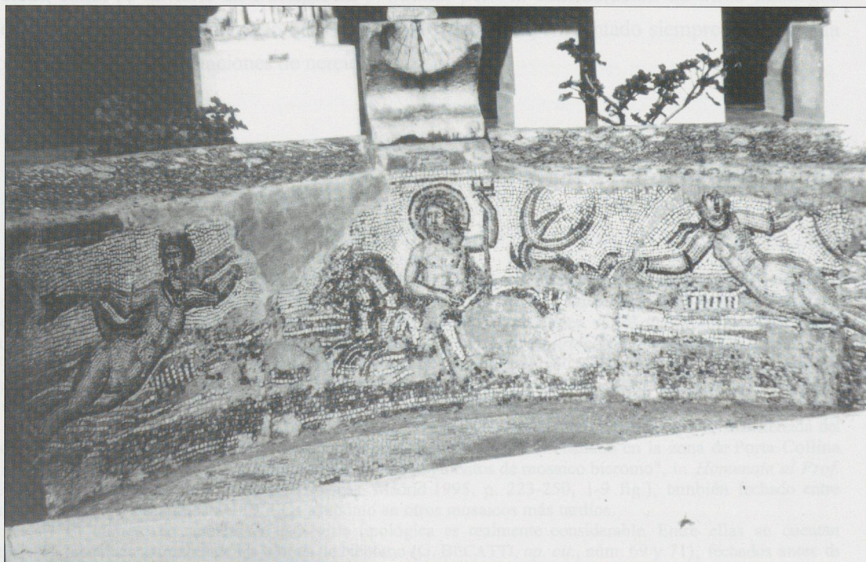
Lám. II - Mosaico parietal de Caesarea .