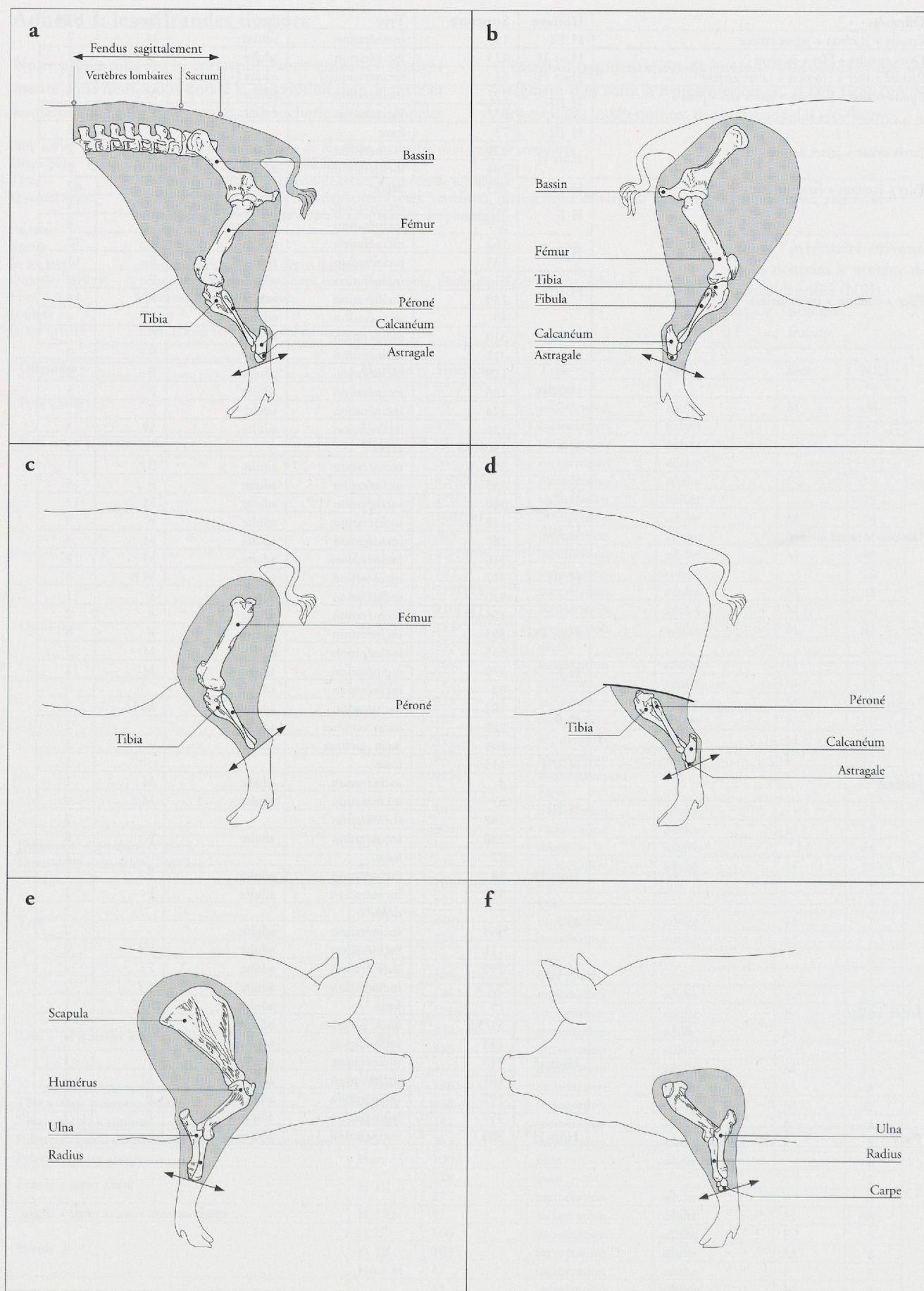
Fig. 170. Avenches-En Chaplix. Quelques exemples d'offrandes de porc. Correspondance des quartiers de viande et des portions squelettiques. a: quartier arrière; b: filet, jambon et jarret arrière; c: jambon et jarret arrière; d: jarret arrière; e: palette, épaule et jarret avant; f: épaule et jarret avant.